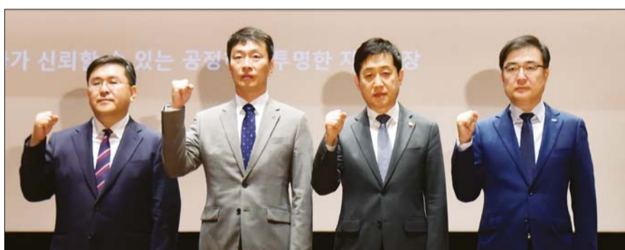
23일 서울 여의도 한국거래소(KRX) 서울사무소에서 열린 '불공정거래 근절을 위한 유관기관 합동토론회'에서 참석자들이 기념 촬영 하고 있다. 양석조 서울 남부지방검찰청장(왼쪽부터), 이복현 금융감독원장, 김주현 금융위원장, 손병두 한국거래소 이사장.

이 원장은 23일 금융위원회, 금융감독원, 한국거래소, 남부지방검찰청 등