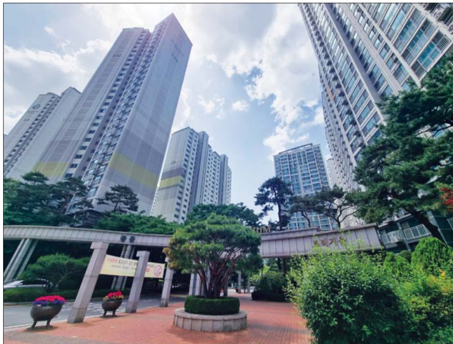
서울 송파구 잠실동 '트리지움'.

지하철 2호선 잠실새내역 7번 출구 바로 앞에 위치한 리센츠는 지난 2008년 7월 입주를 시작했다. 잠실주공 2단지를 재건축해 지은 아파트다. 65개동,