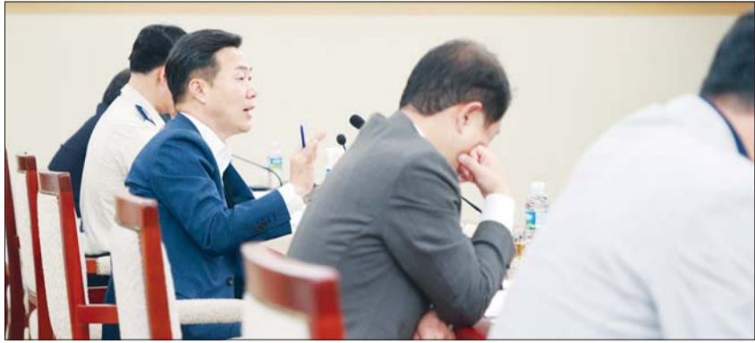
민선8기 역점사업 규제혁신 보고회를 주재하고 있는 이택구 대전시 행정부시장.

건설, 운전 등에 관한 규칙 및 도로교통법 개정이 추진 중이다. 현행 도시철도법에 따라 트램 전용차로 설치시 국토교통부령에서 정하는 기준에 해당하는 경우 혼용차로 설치가 가능하다는 게 대전시 설명이다.