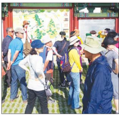
나주시 시티투어, 반남고분군.

매주 토요일 역사문화체험 중심의 정기코스와 둘째 주 일요일 '힐링코스', 넷째 주 일요일 '포토스팟 코스'로 테마별 여행 노선을 다채롭게 구성했다. 운행 시간은 오전 10시 10분부터 오후 5시 5분까지로 모든 코스가 동일하다.