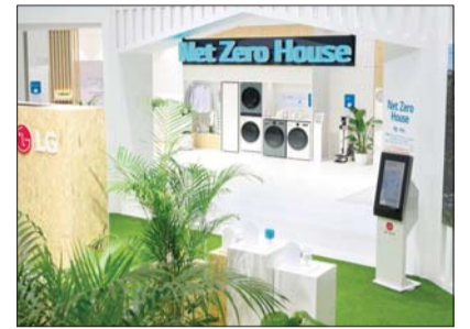
LG 기후산업국제박람회 부스

노력을 소개하고, 가정에서도 지속 가능한 일상을 실천하는 다양한 가전제품을 전시했다. 에어컨과 세탁기 등 주요 제품 에너지 절약 기술과 에코패키지를 활용한 리사이클링 활동 등 미래를 생각하는 삼성전자 기술 철학을 확인한다.