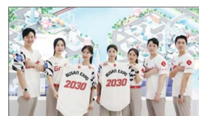
롯데그룹관 프로모터들이 'BUSAN EXPO 2030'이 새겨진 친환경 유니폼을 착용하고 2030 부산세계박람회 유치 홍보 활동을 하고 있다.

롯데가 25~27일 부산 벡스코에서 열리는 '제1회 기후산업국제박람회(WCE)'에서 그룹의 탄소중립 활동과 함께 '넷제로 시티 부산'의 미래 모습을 선보일 예정이라고 밝혔다. WCE는 ▲탄소중립관 ▲청정에너지관 ▲에너지효율관 ▲미래 모빌