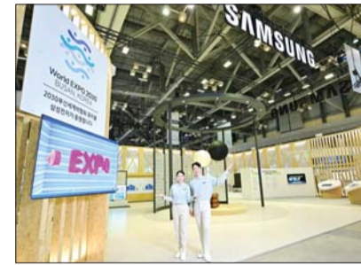
삼성 기후산업국제박람회 홍보관