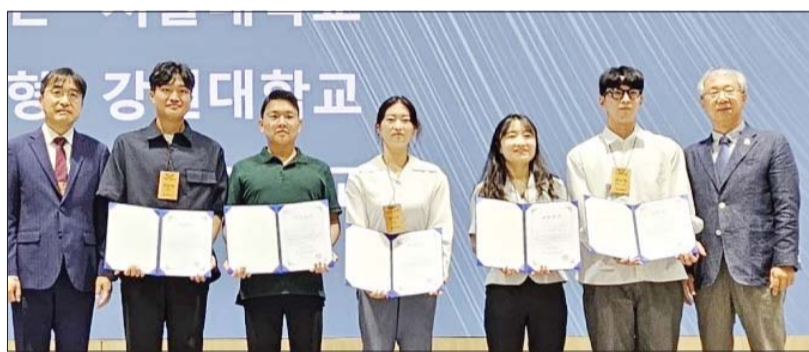
정인욱학술장학재단은 산림Pioneer 장학생 5명에게 장학 증서를 수여했다. 참석자들이 기념촬영을 하고 있다.

산림·임업분야의 석·박사과정 대학원생을 대상으로 현장에서 적용가능한 기술 연구를 지원하는 사업이다. 이번에 뽑은 5명의 장학생은 2년