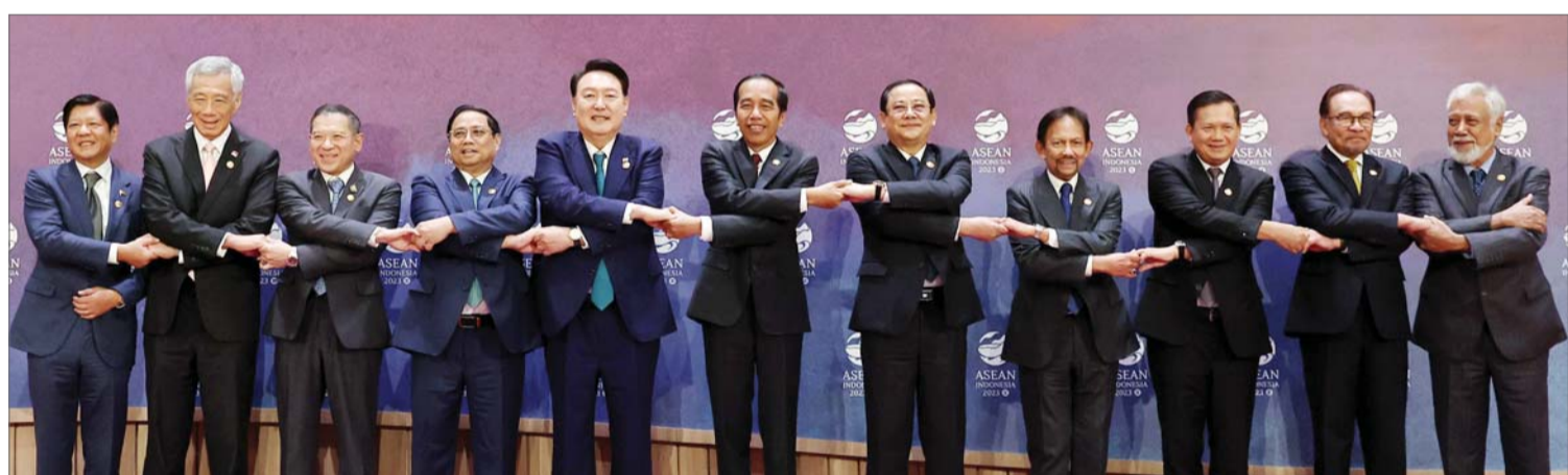
윤석열 대통령이 6일(현지시간) 자카르타 컨벤션센터(JCC)에서 열린 한-아세안 정상회의에 앞서 기념촬영하고 있다.