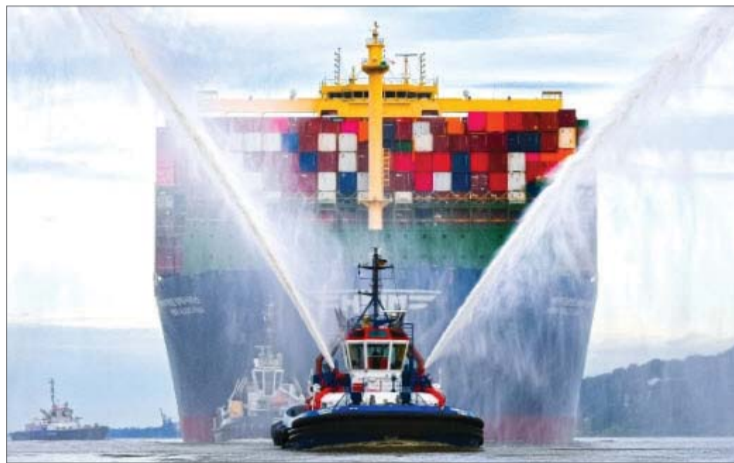
HMM 선박 /HMM

하림-LX-동원 후보 압축 대규모 금융조달 없이 불가 인수엔 고금리로 빚 갚아야 HMM 재무지표 악화 가능성 산은·해진공 영구채도 과제