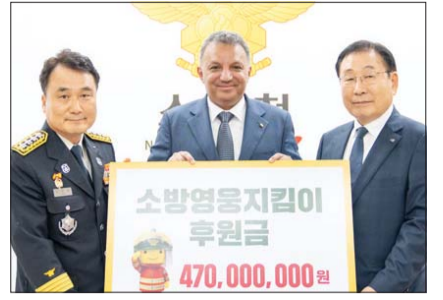
에쓰오일, 소방영웅지킴이 후원금 전달

에쓰오일은 소방청과 한국사회복지협의회와 함께 18일 세종시 소재 소방청사에서 소방영웅지킴이 후원금으로 4억 7000만원을 전달했다. 에쓰오일 안와르 알 히즈아지 CEO(가운데)와 소방청장 남화영(왼쪽), 한국사회복지협의회장 김성이(오른쪽)가 후원금 전달식에서 기념촬영을 하고 있다.