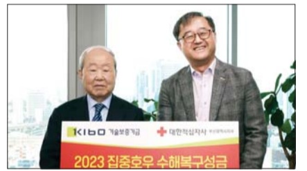
기보, 대한적십자사에 헌혈증·성금 기탁

효성은 15일부터 17일까지 '2023년 효성·푸르메재단과 함께하는 가족 여행'을 진행했다고 18일 밝혔다. 2박3일 일정으로 임직원과 장애아동 가족 각 10가족이 참여했다. 강원도 춘천시 레고랜드와 휴천 소노벨 비발디파크 등에서 시간을 보냈다. /효성