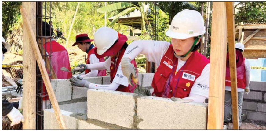
LG에너지솔루션 임직원들이 인도네시아 카라왕시 와나자야 마을에서 건축 봉사활동을 하고 있다.

LG에너지솔루션은 해외에서도 다양한 봉사활동을 경험하고자 하는 구성원들의 목소리를 반영해 지난 5월부