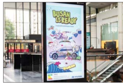
현대차그룹이 부산엑스포 유치 지원을 위해 제작한 광고영상이 상영되고 있다. /양성운 기자

현대차그룹은 오는 30일까지 프랑스 파리 시내 주요 명소와 쇼핑몰 등에 있는 270여개 디지털 스크린을 활용해 부산엑스포 유치전에 나선다고 2일 밝혔다. 지난 1일 시작된 이번 유치전은 BIE 본부가 위치한 파리에서 /양성운 기자