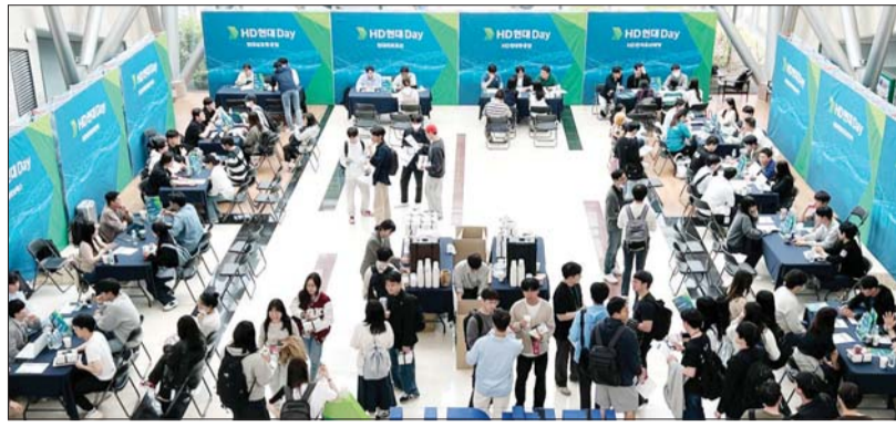
지난 5월 서울 성북구 고려대학교에서 진행된 HD현대DAY 행사 모습

HD현대DAY는 조선해양, 에너지, 건설기계 등 핵심 사업 분야의 임원과 인사담당자가 출신대학교를 방문해 HD현대의 비전, 사업분야, 기업문화 등을 적극 알리기 위해 마련한 '찾아가는 채용박람회'다. 이번 행사에서 HD현대는 취업준