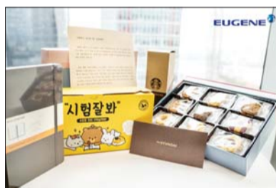
유진기업이 수능을 앞둔 임직원 자녀들에게 전달한 수능 응원선물 세트.

같은 수능시험이 눈 앞으로 다가온 만큼 힘찬 격려와 응원의 마음을 전한다”며 “그동안 갈고 닦은 실력을 수능 당일 마음껏 발휘할 수 있길 바란다”고 응원했다.