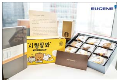
유진기업이 수능을 앞둔 임직원 자녀들에게 전달한 수능 응원선물 세트.

같은 수능시험이 눈 앞으로 다가온 만큼 힘찬 격려와 응원의 마음을 전한다"며 "그동안 갈고 닦은 실력을 수능 당일 마음껏 발휘할 수 있길 바란다"고 응원했다.