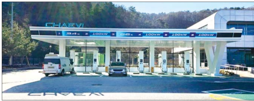
광주원주고속도로 양평휴게소에 설치되어 있는 전기차 충전소.

구리포천고속도로 별내휴게소와 의정부휴게소에도 설 명절에 고객들이 편리하게 이용할 수 있도록 단독 2기, 차량 2대가 동시 충전이 가능한 듀얼 1기가 설치되어 있으며, 휴게소별로