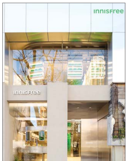
'이니스프리 도쿄 오모테산도 플래그십 스토어' 전경. /이니스프리

아울러 이니스프리 글로벌 모델인 세븐틴 민규는 지난 1월 31일 '오모테산도 플래그십 스토어'를 방문했다. 매장을 둘러보고 제품을 살펴보는 현지 팬들의 이목을 끌었다. /이청하 기자