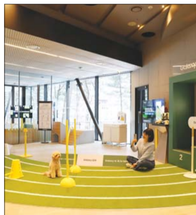
갤럭시 스튜디오 Pet.

물을 넘고 트랙을 달리는 역동적인 반려동물의 모습을 ‘싱글 테이크’로 촬영해 AI가 생성하는 베스트 포토, 하이라이트 영상 등을 확인할 수 있다. ‘인스턴트 슬로모’ 기능을 활용해 반려동물의 사랑스러운 순간을 생생하면서도 디테일하게 감상할 수도 있다. ‘프로필 포토 부스’에서는 펫도 인식하는 ‘갤럭시 S24 시리즈’의 인물 모드 기능으로 반려견의 프로필 사진을 촬영할 수 있다. ‘생성형 편집’ 기능을 활용해 보다 완벽한 ‘견생샷’을 완성해준다.