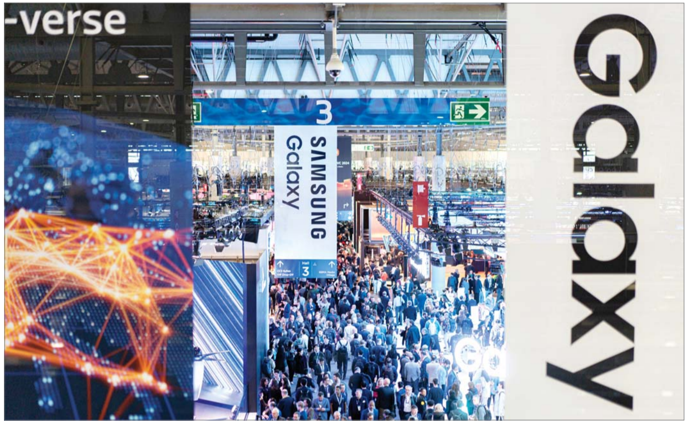
MWC 2024 개막

26일(현지시간) 스페인 바르셀로나에서 세계 최대 이동통신 전시회 ‘2024 모바일 월드 콩그레스’(MWC)가 열려 방문객들이 삼성전자 전시관 주변을 지나고 있다. 2024 MWC는 오는 29일까지 열린다. <관련기사 3면>