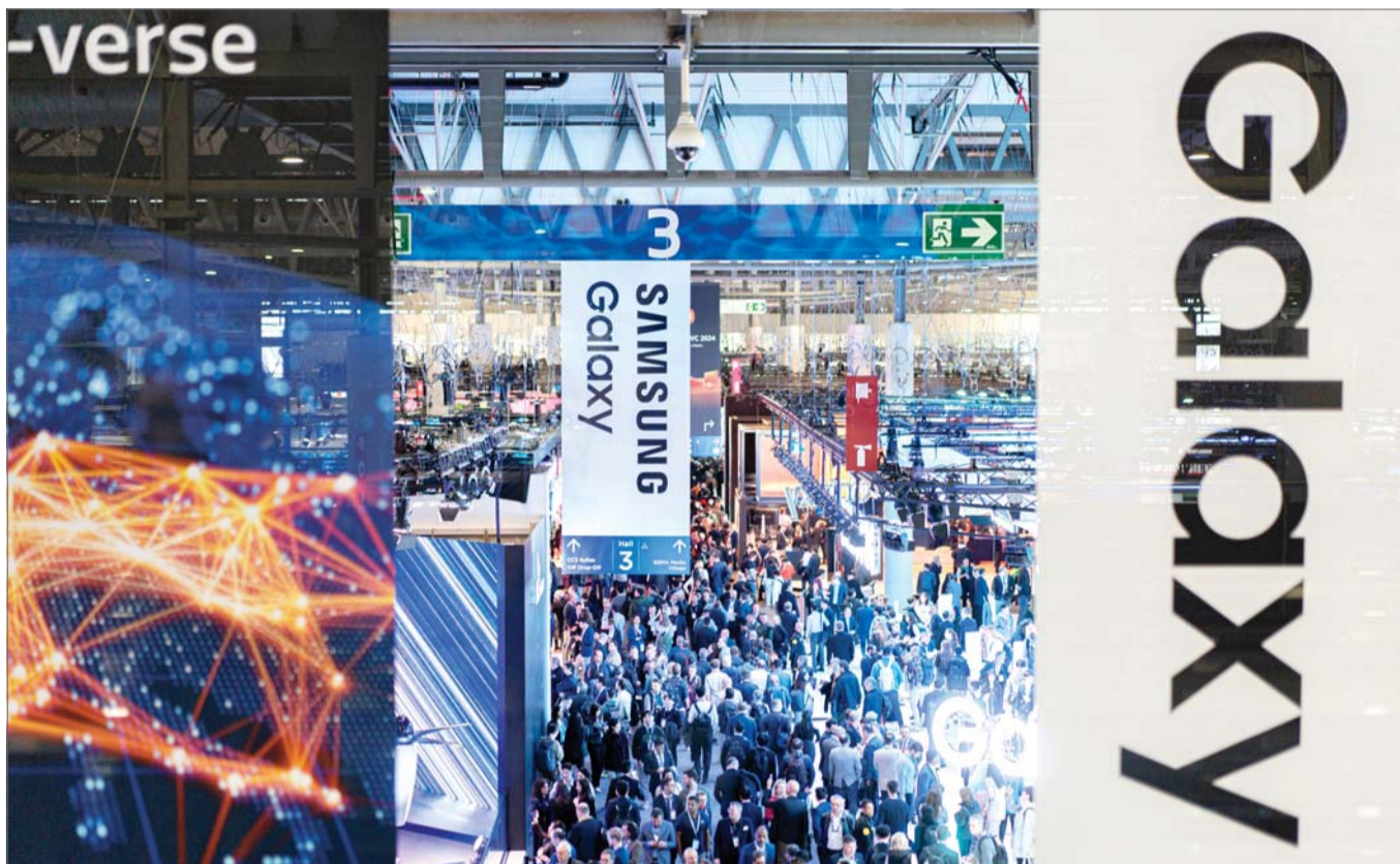
MWC 2024 개막

26일(현지시각) 스페인 바르셀로나에서 세계 최대 이동통신 전시회 ‘2024 모바일 월드 콩그레스’(MWC)가 열려 방문객들이 삼성전자 전시관 주변을 지나고 있다. 2024 MWC는 오는 29일까지 열린다. <관련기사 3면>