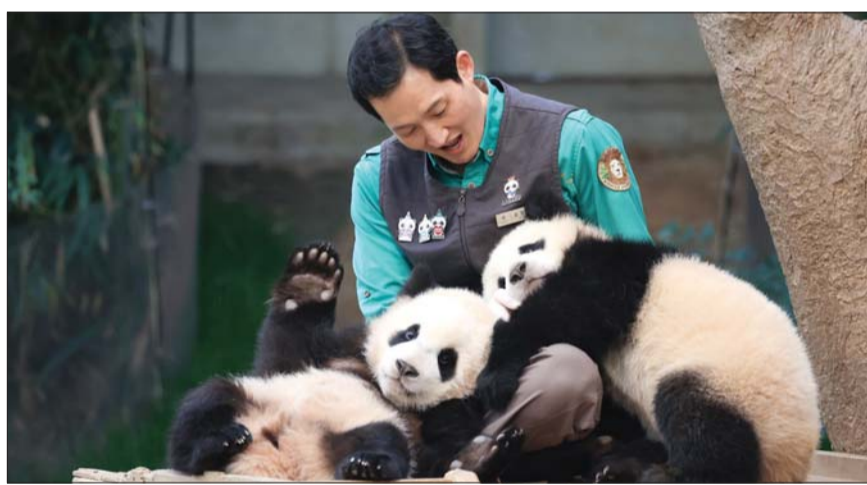
“SNS로 쌍둥이판다 일상 함께하세요”

삼성물산 리조트부문은 에버랜드의 쌍둥이 판다 루이바오, 후이바오가 퇴근 무렵 모습을 14일 SNS에 공개했다. 공개된 사진에는 루이바오, 후이바오가 키보드 활선 높은 나무에 올라가려 하거나 사육사 할부지의 장화를 잡고 조르는 듯한 장면, 사육사들의 품에 안겨 집으로 들어가는 모습들이 담겨 있다.