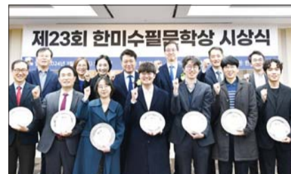
한미약품, ‘한미수필문학상’ 시상

우리은행은 지난 13일 대구·경북, 울산, 호남 등 3개 지역에 중소기업 특화 채널 BIZ프라임센터를 추가 개설했다고 밝혔다. BIZ프라임센터는 지난해 7월 조병규 은행장이 취임과 동시에 ‘기업금융 명가’ 재건 전략을 담아 신설한 중소기업 특화 채널이다.