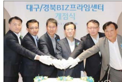
우리은행, BIZ프라임센터 추가 개설

우리은행은 지난 13일 대구·경북, 울산, 호남 등 3개 지역에 중소기업 특화 채널 BIZ프라임센터를 추가 개설했다고 밝혔다. BIZ프라임센터는 지난해 7월 조병규 은행장이 취임과 동시에 ‘기업금융 명가’ 재건 전략을 담아 신설한 중소기업 특화 채널이다.