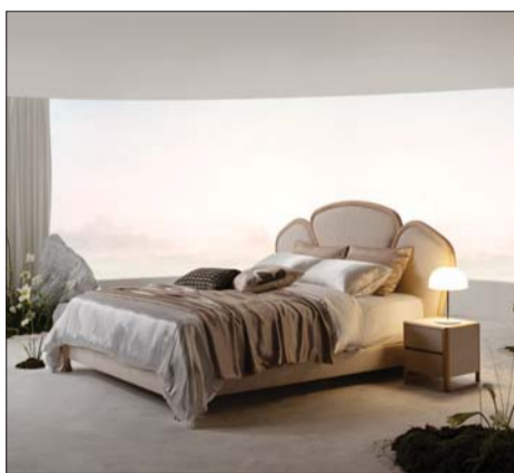
현대리바트의 마이스터 컬렉션 '플로랄' 침대.

마이스터 컬렉션은 5가지 컨셉의 공간테마 ▲Quiet Luxury ▲Object ▲Rarer ▲Unique ▲Nano Furniture를 개발하고 이에 맞는 신제품 라인업을 자사 프리미엄 가구 개발 연구실 '마이스터 랩(Meister LAB)'을 통해 지속적으로 선보이고 있다. 가구를 단순히 실용적인 측면을 넘어 스토리가 담긴 하나의 작품으로 만들어 소장가치를 높이기 위해서다.