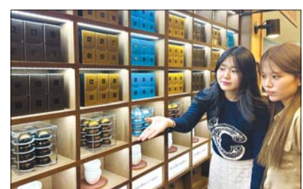
24일 오전, 서울 양천구에 위치한 현대백화점 목동점 ‘네스프레소 버추오 더블 에스프레소 바’ 팝업스토어에서 직원들이 상품을 소개하고 있다.

또한 행사 기간 내 커피 캡슐(12슬리브)을 구매하면 특별 사은품으로 초콜릿을 한정수량 증정하고, 버추오 머신