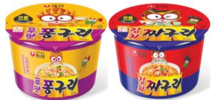
푸팟퐁구리 큰사발면, 김치짜구리 큰사발면.