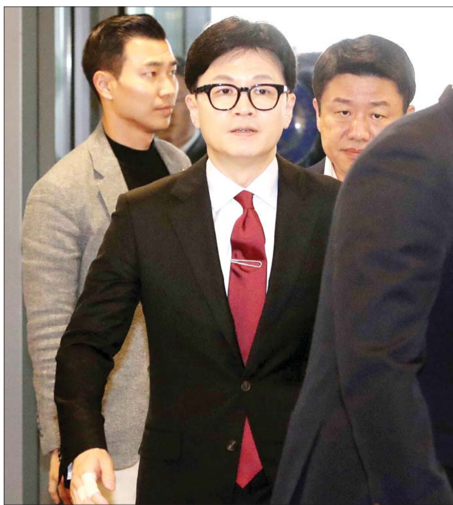
한동훈, 전국대의대교수 회장단 면담

한국 식품의약품안전처 역시 지난 12월과 올해 1월에 걸쳐 '의약품 품목허가·신고·심사규정'과 '의약품 임상시험 계획 승인에 관한 규정' 고시를 개정했다. 개정된 고시는 "독성자료 제출 시 비동물 또는 인체 생물학 기반 시험 자료로 대체할 수 있다"고 명시했다. 인체 생물학 기반 시험이란 동물 모델이 아니라 사람에 대한 생물학적인 반응을