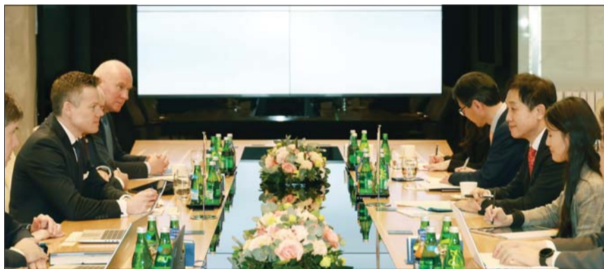
김주현 금융위원장(오른쪽 두번째)과 야책 야스트로제브스키(Jacek Jastrzebski) 폴란드 금융감독청장이 회담을 하고 있다.

김주현 금융위원장이 폴란드를 방문해 K-금융 수출을 위한 발판을 마련했다. 금융위원회는 28일 김주현 금융위원장이 폴란드를 방문해 새로운 협력관계를 구축했다고 밝혔다. 김 위원장은 야책 야스트로제브스키(Jacek Jastrzebski) 폴란드 금융감독청장과 회담을 갖고 폴란드 진출을 추진하는 은행들의 인허가 심사를 위해 자료공유 등을 요청했다. 폴란드는 1989년 수교 이후 국내 기업들의 유럽 내 생산기지로 불리고 있다. 국내 기업들은 지난 2023년 7월 정상회담 이후 방산·원전·인프라, 우크라이나 재건 등 대규모 협력 사업을 위한 진출을 준비하고 있다. 이날 김 위원장과 Jacek 금융감독청