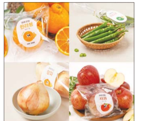
1~2인 가구 위한 소포장 신선식품 '하루' 출시.