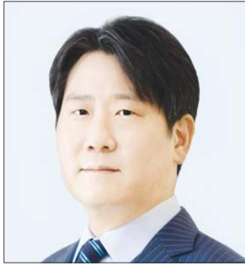
정교선 현대백화점그룹 부회장