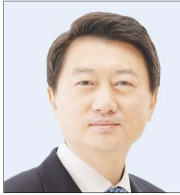
장호진 현대지에프홀딩스 대표이사 사장

사명인 현대지에프홀딩스(HYUND AIG.F. HOLDINGS)는 그룹 전체 임 직원들이 100년 그 이상 지속되는 현대 백화점그룹의 새로운 역사와 미래(Fut ure)를 만들어 나가는(Generate)에 중 추 역할을 하겠다는 의미를 담고 있다.