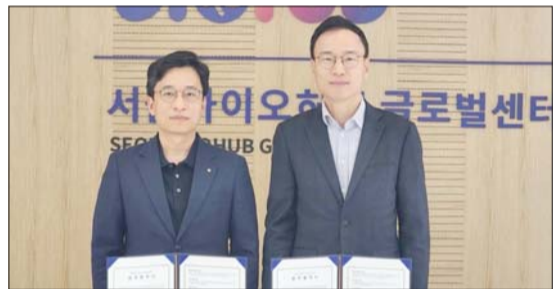
인포뱅크-SBH, 바이오 스타트업 발굴 업무협약