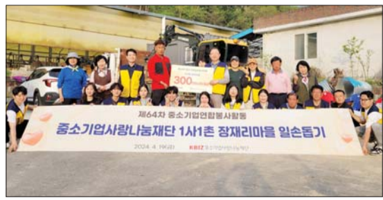
중기사랑나눔재단, 1사1촌 일손돕기 봉사활동

SK증권이 '지구의 날'을 맞아 여의도 일대에서 '담배꽂초 없는 영등포 만들기' 캠페인을 진행했다고 22일 밝혔다. SK증권 임직원 20여 명을 포함해 영등포구청과 다올금융그룹, 신한투자증권, 콘래드서울 및 영등포구 자원봉사센터, CSR Impact 관계자 등 100여 명이 여의도 일대의 휴먼 부스를 중심으로 담배꽂초 줍기와 제대로 버리기 캠페인을 진행했다. /SK증권