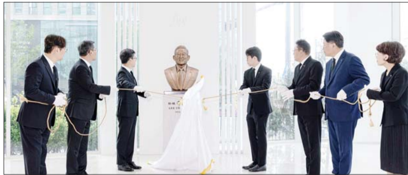
JW그룹은 고(故) 이종호 명예회장의 타계 1주기 추모 행사를 지난 19일 진행했다. 경기도 과천시 소재 JW사옥에서 이 명예회장의 홍상을 공개하는 제막식이 이뤄지고 있다.

평생 필수약품부터 혁신신약까지 '약다운 약'을 만들어 국민 건강을 지키는 '제약보국(製藥保國)' 실현에 앞장섰다.