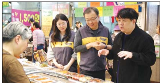
KB자산운용, '상생 소비X상생 나눔 프로젝트' 추진

근로복지공단은 22일 제주특별자치도와 '산재보험 가입 및 보험료 지원'을 위한 업무협약을 체결했다고 밝혔다. 협약에 따라 배달·이동 등 8개 직군 산재보험료 중 노무제공자 본인 부담분의 90%를 최대 8개월간 1억여원의 예산 범위 내 지원한다. 박종길 근로복지공단 이사장 (오른쪽)과 오영훈 제주특별자치도지사가 기념사진을 찍고 있다.