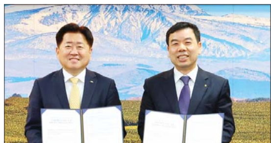
근로복지공-제주도, 배달 직군 등 산재보험 가입 지원

근로복지공단은 22일 제주특별자치도와 '산재보험 가입 및 보험료 지원'을 위한 업무협약을 체결했다고 밝혔다. 협약에 따라 배달·이동 등 8개 직군 산재보험료 중 노무제공자 본인 부담분의 90%를 최대 8개월간 1억여원의 예산 범위 내 지원한다. 박종길 근로복지공단 이사장 (오른쪽)과 오영훈 제주특별자치도지사가 기념사진을 찍고 있다.