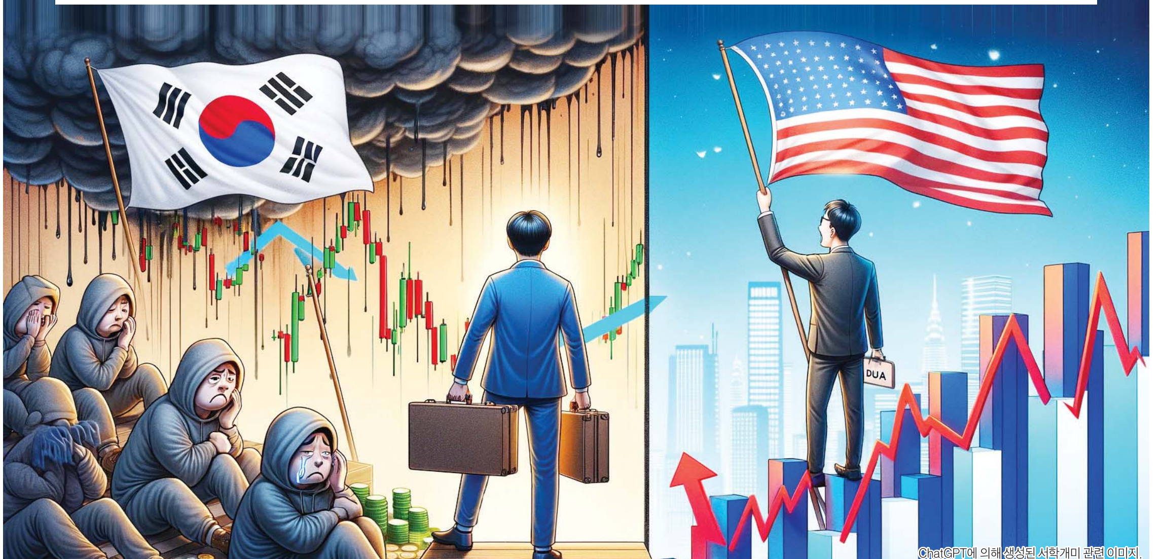
ChatGPT에 의해 생성된 서학개미 관련 이미지.