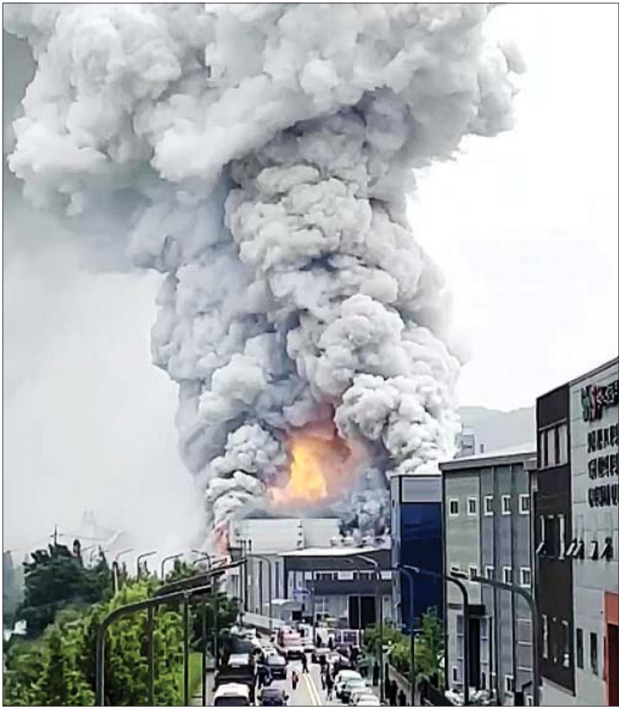
24일 경기도 화성시 서신면 소재 일차전자 제조 업체에서 화재가 발생해 불길과 연기가 치솟고 있다.