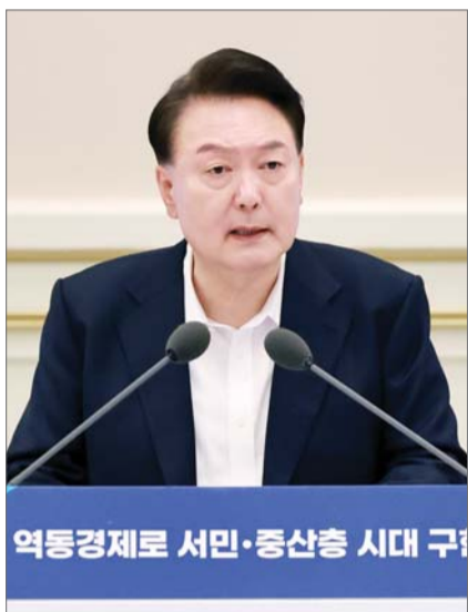
윤석열 대통령이 3일 서울 종로구 청와대 영빈관에서 열린 ‘하반기 경제정책방향 및 역동경제 로드맵 발표’ 행사에서 발언하고 있다.

수출 회복에 성장률 예측치 상향 물가 상승률은 2%대 중반 고수 국제유가 등 불확실성 여전히 커 하반기 취약부문 정책대응 강화 지속가능 역동경제 로드맵 발표