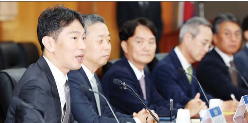
이복현 금감원장이 3일 오전 서울 영등포구 금융투자협회에서 열린 금감원장-증권회사 최고경영자 간담회에서 모두발언하고 있다.

이 원장은 자본시장 선진화를 위해 “늦어도 하반기 중에는 ‘사회적 총의’를