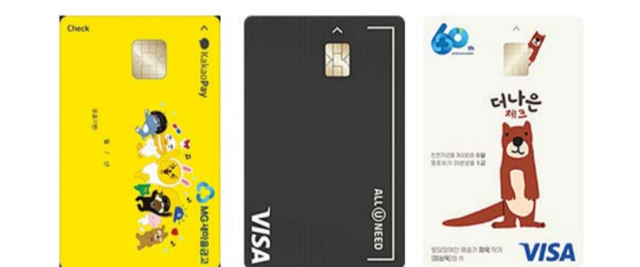
(왼쪽부터) 새마을금고 새마을금고 카카오페이 체크카드, 올유닛 체크카드, 다나는 체크카드 플레이트 이미지.

앞서 새마을금고는 지역금고를 중심으로 체크카드 영업을 강화한 바 있다. 체크카드를 발급받고 우대금리 조건을 충족하면 고금리 정기적금에 가입시켜줬다. 'MGNEW정기적금'의 우대조건