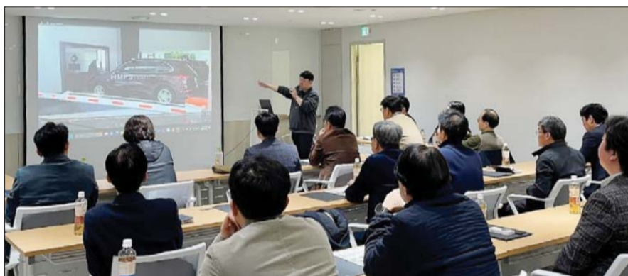
삼표그룹 계열사 에스피엔모빌리티 임직원들이 희림종합건축사사무소에서 기술 세미나를 진행하고 있다.

엠펙시스템은 AGV(무인운반시스템) 방식으로 주차로봇과 딜리버리시스템이 결합된 기술이다. 차량 무게 3t 이