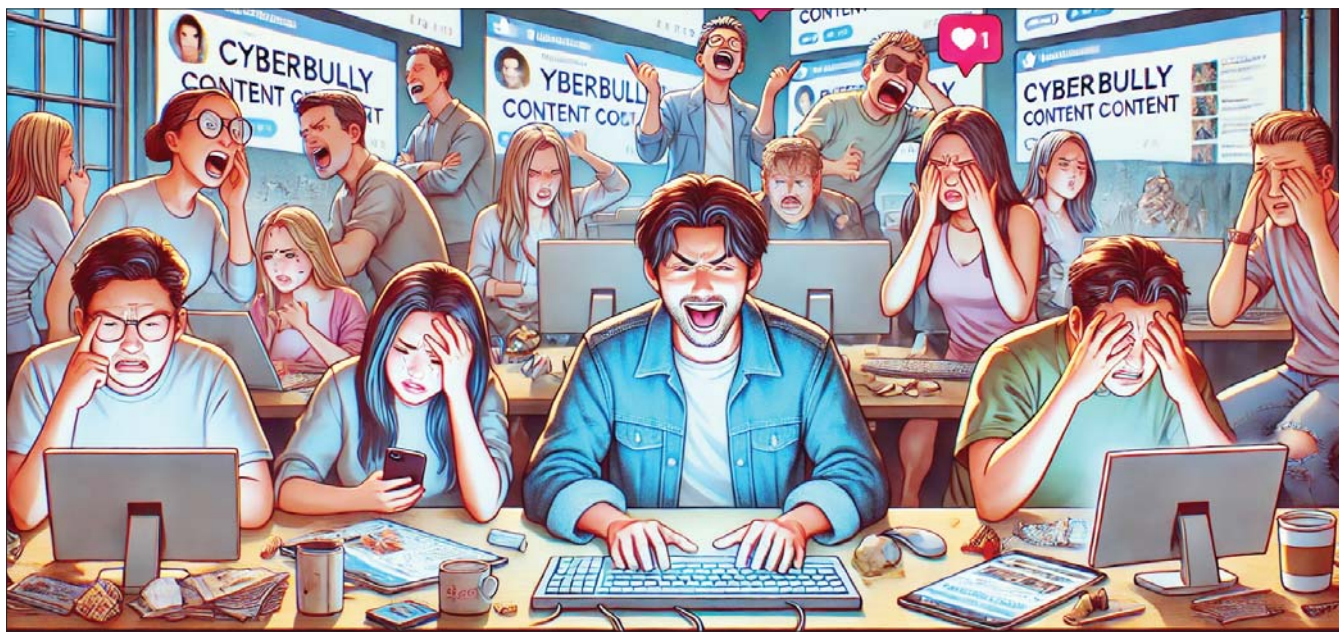
ChatGPT에 의해 생성된 ‘사이버 레커’ 관련 이미지.

양한 문제에 대응하기 위해 알고리즘 조정, 정책 업데이트, 채널 및 영상 제재 조치를 취하고 있다.