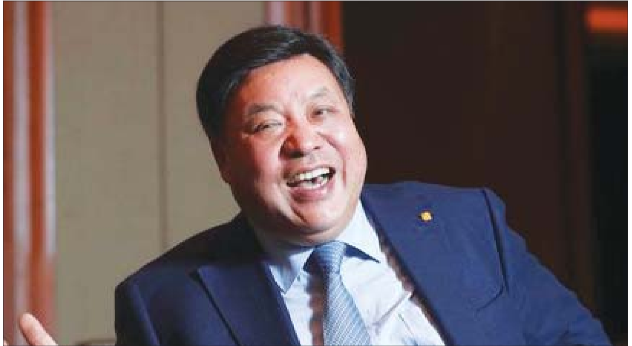
서정진 셀트리온 회장.

결국 서 회장은 바이오시밀러 판권을 확보한 채 개발비를 셰어링하는 방식으로 서 회장만의 비즈니스 모델인 셀