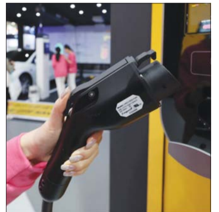
지난 3월 서울 삼성동 코엑스에서 열린 'EV트렌드코리아 2024'에서 전기차 충전서비스가 시연되고 있다.

센터는 전남 나주 혁신산업단지(부지 6632㎡) 내 들어설 예정이다. 오는 2027년 개원을 목표로 현재 센터 건축과 정보화시스템 설계가 진행 중이다. 환경부는 센터 구축과 관련한 사업계획 수립, 예산확보 등의 총괄을 맡는