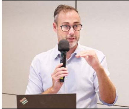
안드레아스 코플러 알토 아디제 와인 협회장이 알토 아디제 와인에 대해 설명하고 있다.