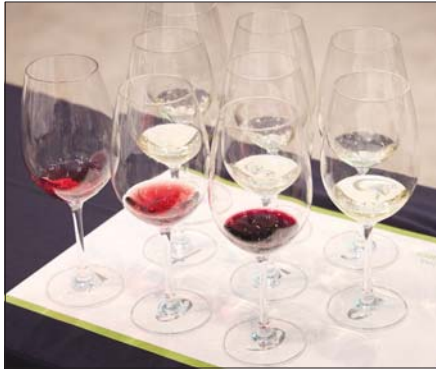
시음을 위해 준비된 알토아디제 와인. /홍스코치 시음

로. 이탈리아 와인이라고 떠올려보니까 레드와인이었다. 와인 좀 마셔봤다면서도 그간 이탈리아 화이트 와인을 너무 과소평가했다. 그야말로 이탈리아 화이트 와인의 재발견이다.