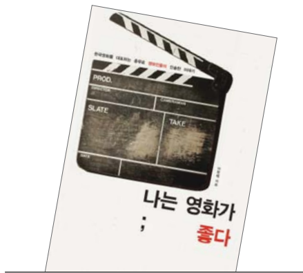
나는 영화가 좋다 이창세 지음/지식의숲

'한국 최초의 여성 조명감독 1호'라는 타이틀을 가진 남진아 감독의 일화가 가장 인상 깊