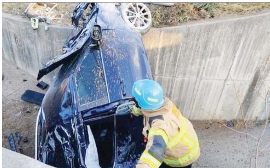
지난 2022년 강릉에서 발생한 급발진 의심 사고 현장 모습. 최근 자동차 급발진 의심 사고가 급증하면서 국가가 관련 법을 잇따라 발의하고 있어 통과 여부가 주목되고 있다.

최근 서울 시청역 인근에서 급발진 주장 차량이 도보에서 있던 행인 9명을 치어 숨지게 하는 사고가 발생하면서 급발진에 대한 두려움을 키우고 있는 상황이다.