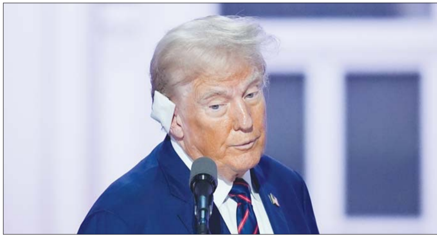
미국 공화당 대선 후보인 도널드 트럼프 전 대통령이 17일(현지시간) 위스콘신주 밀워키의 피셔브 포럼에서 열리는 공화당 전당대회(RNC)를 앞두고 리허설을 하면서 무대를 점검하고 있다.

중국과 갈등 심화, 관세 인상 등 여러 분야에서 변화가 다양하게 예측되는 가운데, 당선이 확정되기까지 미국의 경제정책이 어디로 될지 모르는 상황이다. 한국 산업계는 미국의 경제에 직접적인 영향을 받는 만큼 구체적인 대비