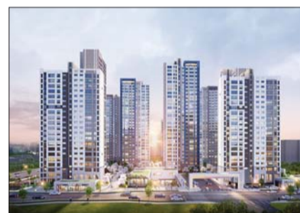
고양 장항 아테라 투지도.