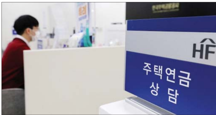
은퇴세대를 중심으로 주택연금에 대한 관심이 높아지고 있다. 한국주택금융공사의 주택연금 상담 창구.

제공하고 매달 일정 금액을 연금으로 받는 정부의 정책금융상품이다. 본인 혹은 배우자가 만 55세 이상이며 주택 가격이 공시가 12억원 이하라면 가입할 수 있다.