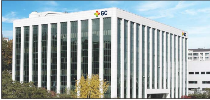
GC녹십자 본사 전경.

GC녹십자가 출하한 알리글로는 미국 내 물류 창고와 유통 업체를 거쳐 전