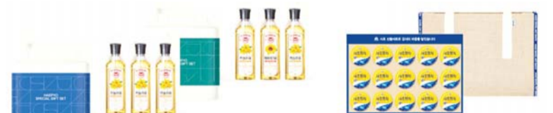
사조대림 추석 선물세트.

자사몰인 '사조몰'을 비롯한 온라인 몰과 전국 대형마트 등 오프라인의 다양한 채널에서 구매가능하다. /신원선 기자 tree6834@