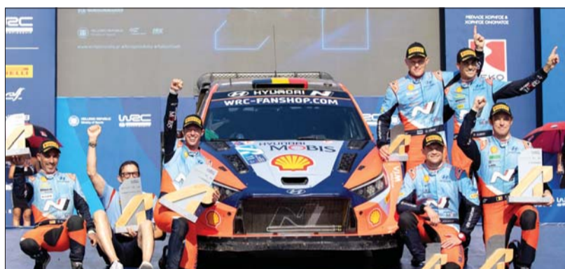
2024 WRC 그리스 랠리에서 트리플 포디움을 달성한 현대 월드랠리팀 시상식 장면

에서의 주행 경험을 바탕으로 팀 동료 2위 다니 소르도와 1분 이상의 차이로 1위를 차지하며 현대 월드랠리팀에 시즌 네 번째 우승컵을 선사했다.