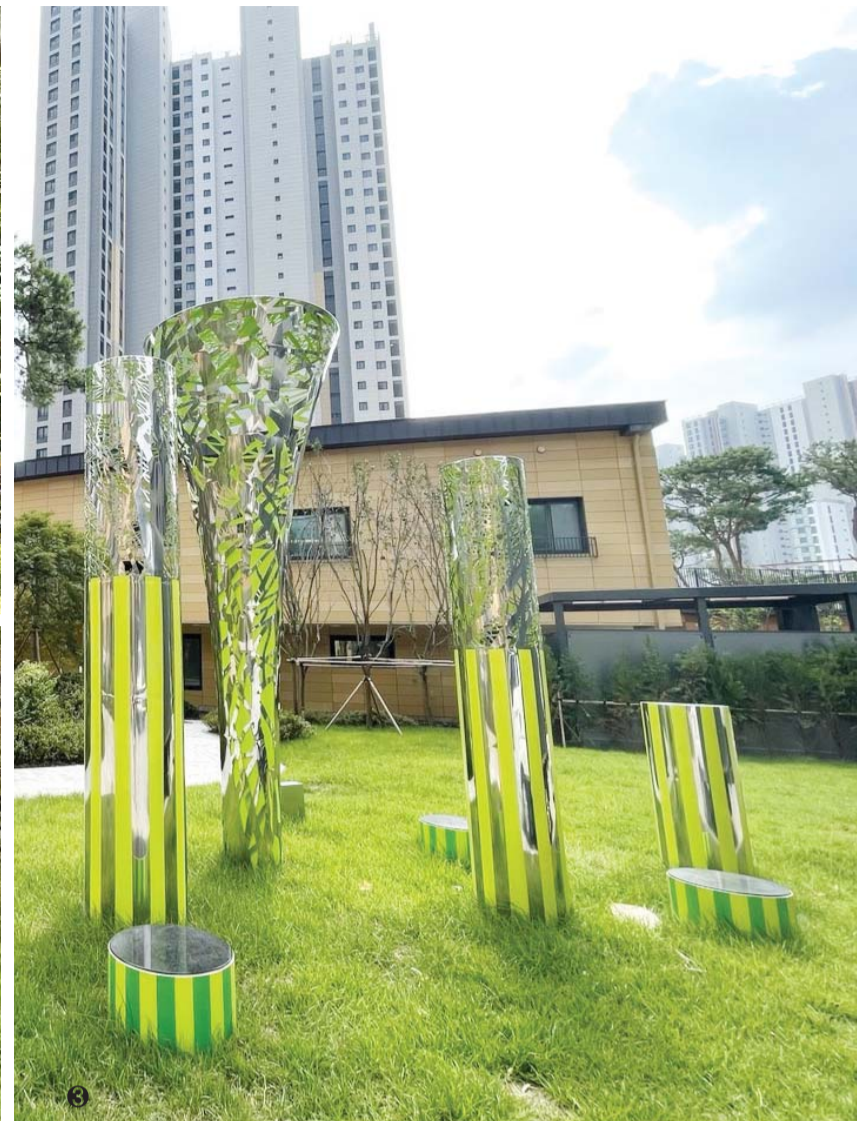
① 단지 내 위치한 '캠 밸리' ② 수생비오톱 ③ 조각상 '리사일런스-트리' ④ 단지 내 산책로 ⑤ '봉담자이프라이드시티' 전경