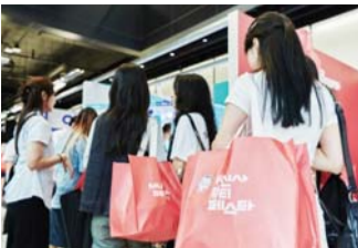
유통업계 뷰티상품 강화 나서 니