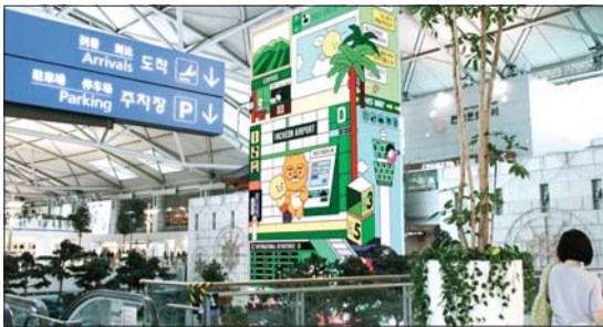
카카오-인천공항공사, 카카오프렌즈 브랜드 캠페인

카카오가 인천국제공항공사와 협업해 카카오프렌즈 브랜드 캠페인을 진행한다. 양사는 공항에서 느낄 수 있는 다양한 감정을 주제로 한 브랜드 영상 ‘플랫폼 오브 이모션즈’를 인천공항 미디어 플랫폼을 통해 선보인다. 카카오프렌즈 캐릭터 ‘라이언’과 ‘춘식이’가 인천공항을 방문해 벌어지는 에피소드 형식이다. 영상은 연말까지 인천공항 내 대형 스크린 55개에서 상영된다.