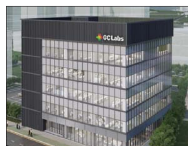
GC녹십자의료재단 영남 분원 준공도 /GC녹십자의료재단

특히 분원에는 아시아태평양 지역 최초로 김체의 수평 및 수직 이동이 가능한 로슈진단의 자동화 장비를 도입했다. /이청하 기자 mllee236@