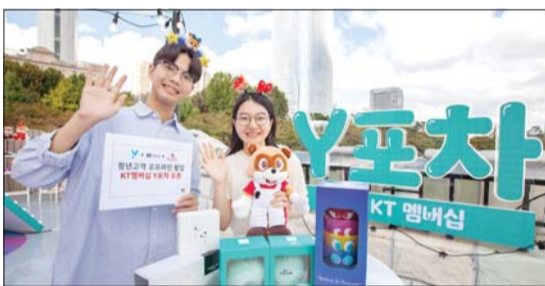
KT, 13일까지 ‘Y포차 팝업스토어’ 운영

카카오모빌리티는 아랍에미리트(UAE)를 구성하는 토착국 중 하나인 샤르자의 디지털청(SDD) 방문단이 판교 사옥을 방문해 미래 모빌리티 기술을 체험하고 향후 협력 방안을 논의했다고 9일 밝혔다. 카카오모빌리티는 자율주행·로봇·디지털트윈 등 미래 모빌리티 기술에 대한 비전과 실제 서비스 적용 사례 등을 공유했다.