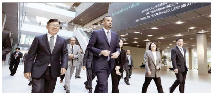
지난 8일 경기도 성남시에 위치한 네이버 1784를 방문한 파이살 빈 아야프(Faisal bin Ayyaf) 리야드 시장 일행을 채선주 네이버 ESG대외 정책 대표, 석상욱 네이버랩스 대표, 김유원 네이버클라우드 대표가 맞이하고 있다. /네이버

이번 방문은 오는 10일부터 개최될 서울시 스마트 라이프 워크를 위해 방한하는 것을 계기로 이뤄졌다. 이번 방문에는 파이살 빈 아야프 리야드 시장과 모하메드 알부티 NHC CEO, 아세르 알로바이단 CEO, 마이클 다이크 뉴 무라바 CEO, 아심 알-슈하이바니 등이 참석했다.