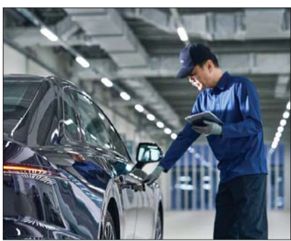
현대차 인증중고차 상품화 전담인력이 품질점검을 진행하고 있다.

증중고차' 서비스를 냈으며, KG모빌리티도 2024년 5월부터 인증중고차 서비스를 운영하고 있다.