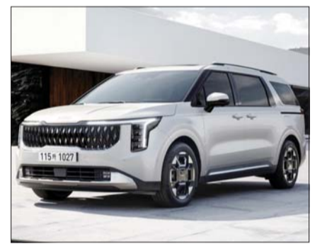
'더 2025 카니발' 전측면.