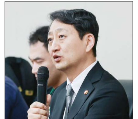
안덕근 산업통상자원부 장관이 14일 오후 정부세종청사 산업부 기자실에서 열린 간담회에서 발언하고 있다.

필리핀과 체결한 바탄원전 타당성조사 MOU에 대해선 “상당히 오랜 기간 방치돼 있는 설비를 어떻게 활용 가능한지 한수원에서 점검하겠다는 것”이라며 “(바탄원전 참여에 대한)경제성 등이 나오면 필리핀 정부와 어떤 것들을 준비해야 할지 여러가지 단계에 걸쳐 조