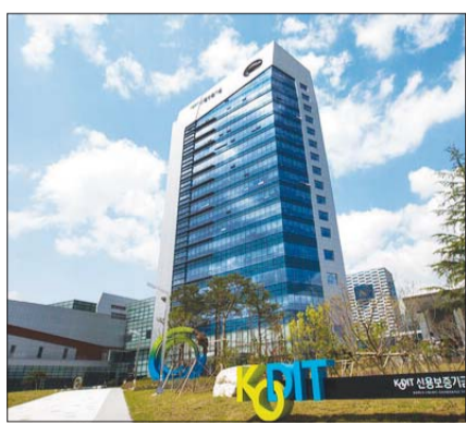
신용보증기금 본사 전경.

2022년 7.8%, 2023년 5.9%로 계속 낮아지고 있으며, 올해 9월까지 회수율은 4.4%로 2021년에 대비 절반 수준으로 저조한 상황이다.