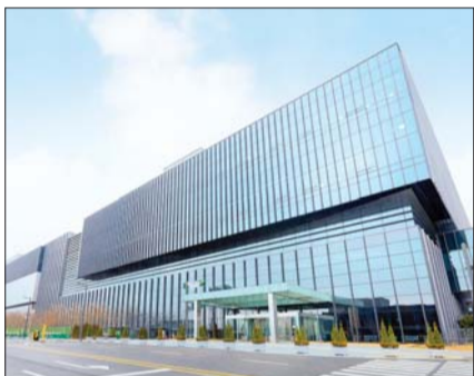
삼성바이오로직스 제3공장 전경

제형 개발역량 확장... 플랫폼 고도화 고농도 의약품 시장 수요 선제 대응