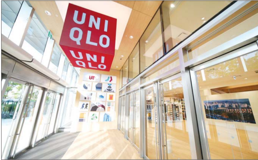
유니클로 롯데월드몰점 입구에 위치한 대형 로고

올해 3조엔 이상 매출 달성 국내 최대규모 롯데월드점 오픈 온·오프라인 연계 서비스 강화