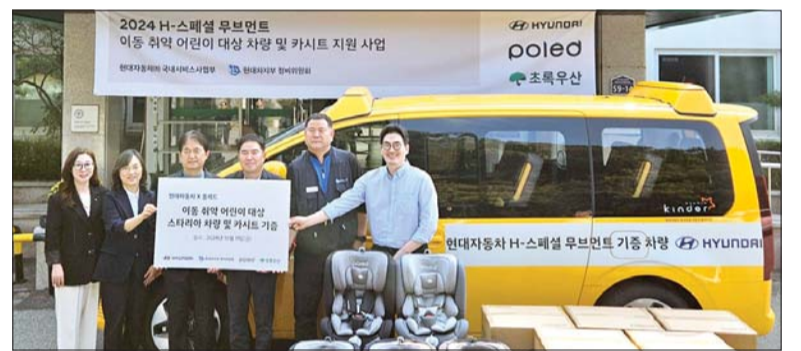
현대차는 지난 11일 경기도 광주에 있는 초록우산 한사랑마을에서 '스타리아 휠체어 리프트', '스타리아 킨더' 차량 2대와 어린이 카시트 기증식을 진행했다.

의 협업을 통해 우수한 품질의 카시트를 확보했으며, '폴레드'에서는 보호매트, 선바이저 등 카시트 액세서리와 신생아 바구니카시트 100대를 추가로 지원했다.