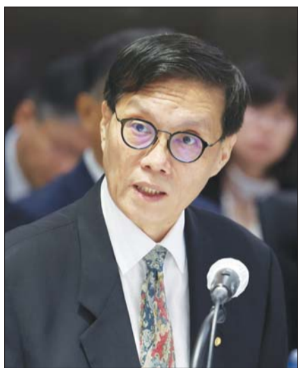
이창용 한국은행 총재가 14일 서울 중구 한국은행 본부에서 열린 국회 기획재정부 국정감사에 출석해 의원의 질문에 답변하고 있다.

앞서 이 총재는 2022년 7월 소비자물가상승률이 6.3%까지 뛰자 금리를 인상하며 소비자물가상승률이 2%(목표치)가 돼야 한다고 언급했다. 지난 3월