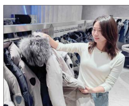
한 고객이 롯데백화점에서 패딩을 구경하는 모습.

프리미엄 아우터부터 스포츠&애슬레저 대표 아우터까지 다양한 취향을 반영한 아우터를 만나볼 수 있다. 먼저, 17일부터 20일까지 4일간은 행사 기간 중에 스포츠&애슬레저 행사 참여 브랜드에서 당일 20만/40만원 이상, 골프 상품군에서 당일 60만/100만/200만/300만원 이상 구매한 고객을 대상으로 10% 상당의 롯데모바일상품권을 증정하는 프로모션을 준비했다. 17일부터 27일까지는 롯데백화점