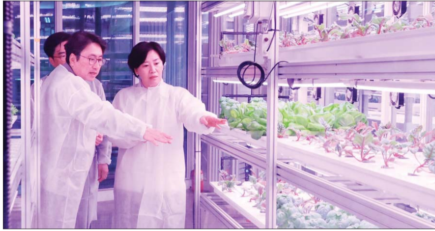
송미령 농식품부 장관이 지난 4월15일 서울 동작구 상도역 역사 내에 조성된 수직농장을 둘러보고 있다.

규제혁신 과제 50개 확정 송미령 농식품부 장관 “시대 뒤떨어진 낡은 규제 혁파로 농정 3대 전환, 농촌 구조혁신 가속”