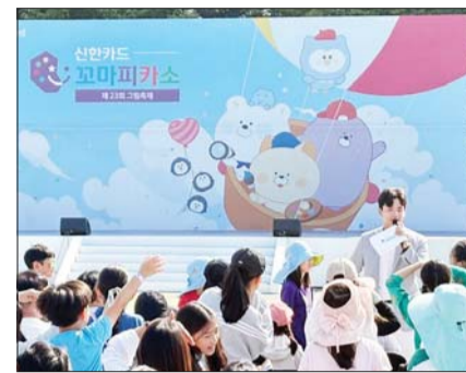
신한카드 꼬마피카소 그림축제.