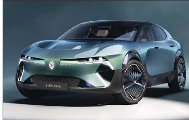
기아 르노그룹의 새로운 엠블럼 콘셉트카.