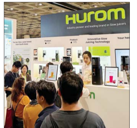
휴롬이 '홍콩 추계 전자박람회'에서 마련한 부스에서 방문객들이 제품을 살펴보고 있다.

특히 멀티스크루를 적용해 사용 편의성을 강조한 이지(easy) 라인업의 착즙기와 착즙망으로 더 많은 주스를 착즙할 수 있는 퓨어(pure) 라인업의 착즙기로 구분해 제품의 특징점을 소개하고, 휴롬의 저속착즙기술을 구현하는 핵심 부품인 스크루를 발전 과정에 따