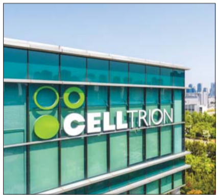
셀트리온 2공장 전경

또 셀트리온은 지난 2023년 12월에는 일본 의약품의료기기종합기구(PMDA)로부터 CT-P55 임상 1상 IND 승인을 획득하기도 했다. 현재 셀트리온