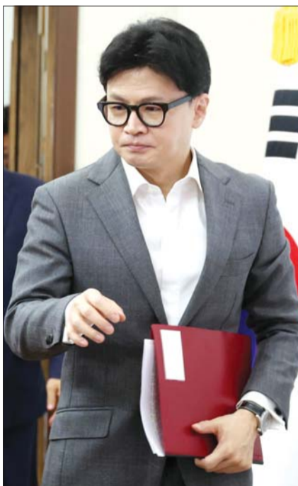
한동훈 국민의힘 대표가 14일 오전 서울 여의도 국회에서 열린 최고위원회의에 참석하고 있다.

그러면서 "브로커나 기회주의자들에게 의해서 보수정치가, 국민의힘이 휘둘리는 것 같이 보이는 면이 있었다"면서 "(국민께서) 오해하시는 것도 있었고 국