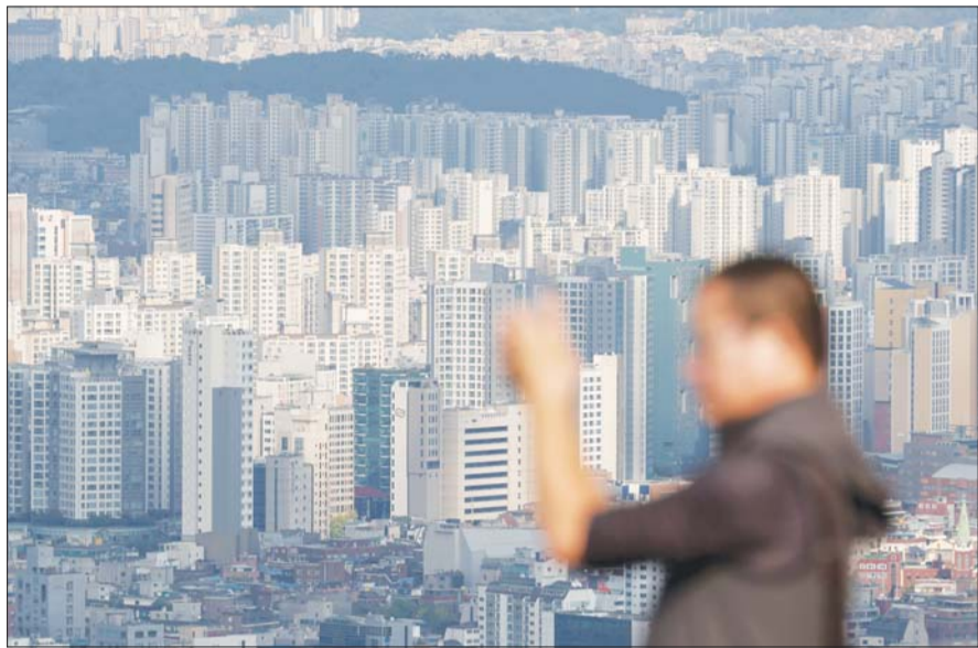
서울 남산에서 바라본 서울 시내 아파트 단지.

14일 이연희 더불어민주당 의원이 국토교통부로부터 제출받은 '2022년 이후 연도별, 연령대별 자금조달계획서상 자금조달 방법' 자료에 따르면 올해 들어 지난 8월까지(계약일 기준) 주택 매수자는 '부동산 처분대금'으로 자금을 조달하겠다고 신고한 비중이 57.8%에 달