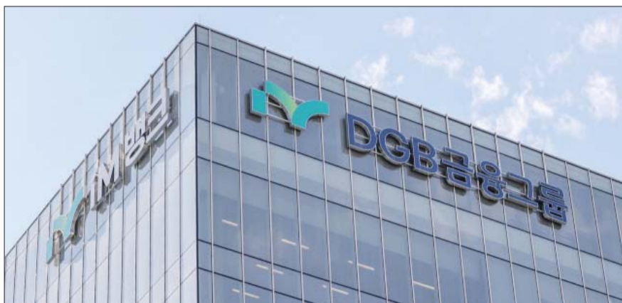
DGB금융은 3분기 실적에서 지방금융지주 중 가장 높은 전년 대비 성장률을 기록할 전망이다. DGB금융이 위치한 대구 iM뱅크 제2본점.

지주사별로는 DGB금융이 1230억원의 순이익이 예상돼 전년 대비 7%의 성장률을 기록할 전망이다, BNK금융이 전년 대비 6.1% 증가한 2168억원, JB금융이 전년 대비 4.9% 성장한 1755억원의 실적을 내놓을 전망이다.