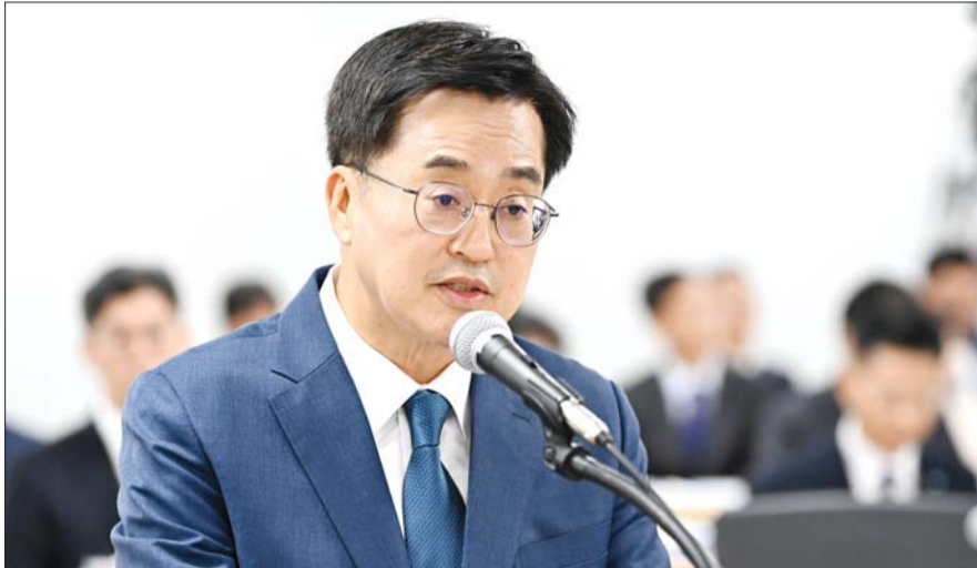
김동연 경기도지사가 14일 경기도 수원시 경기도청에서 열린 국회 행정안전위원회의 경기도에 대한 국정감사에서 업무보고를 하고 있다.

국민연금 일산대교 운영권 강제 회수 김동연 "일산대교만 통행료 받아" 재난기본소득·지역화폐 운영사 논쟁 민주당, 양평 고속도로 종점 변경 김건희 여사 일가 연루 의혹 제기