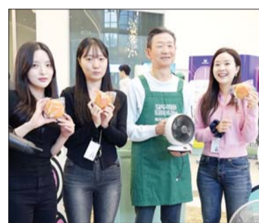
황현식 LG유플러스 대표(왼쪽 세번째)가 14일 용산사옥에서 전자폐기물 수거 캠페인에 동참하며 전자제품을 전달한 직원들과 기념촬영을 하고 있다.

철, 구리, 알루미늄 등 경제적 가치가 있는 자원을 분해하는 작업을 거쳐 재활용될 예정이다.