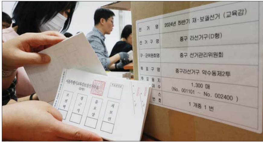
서울시교육감 재·보궐선거를 이틀 앞둔 14일 오전 서울 중구선거관리위원회에서 선관위 관계자들이 투표용지를 검수하고 있다.