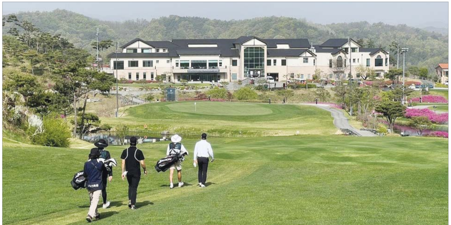
KPGA투어 파운더스컵 개최지 한맥 컨트리클럽.