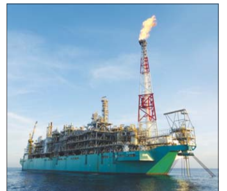
한화오션이 건조한 세계최초 FLNG.

맥 주식을 50%보다 많이 확보하게 되며 싱가포르 경쟁당국의 승인을 얻어야 한다. 현재까지 한화에어로스페이스와 한화오션은 이미 1158억원을 투자해 다이나맥의 지분 24.0%를 확보한 상태이다.