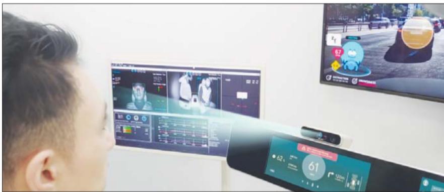
LG전자 인캐빈 센싱.

이를 위해 '도로주행 시뮬레이터'로 테스트한 운전자 반응 데이터를 LG전자의 인캐빈 센싱 솔루션에 적용한다. 이 시뮬레이터는 가상현실 기술을 이용해