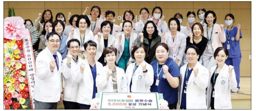
이대서울병원은 지난 7일 본원 지하2층 대강당에서 로봇수술 5000례 달성 기념 심포지엄을 개최했다.