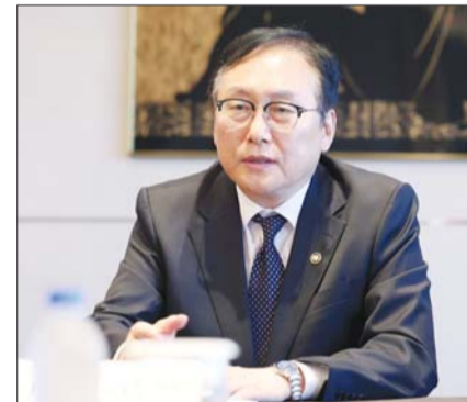
정인교 산업통상자원부 통상교섭본부장이 26일 서울 중구 소공동 롯데호텔에서 에미 킵소이(Emmy Kipsoi) 주한 케냐대사와 면담을 갖고, 한-케냐 경제동반협정(EPA) 등 양국간 경제협력 확대 방안 등을 논의하고 있다.

임병구 플렉스 전략연구소 소장은 발표에서 우리나라 플랜트 산업이 한 단계 도약하기 위해 기존 EPC 중심의