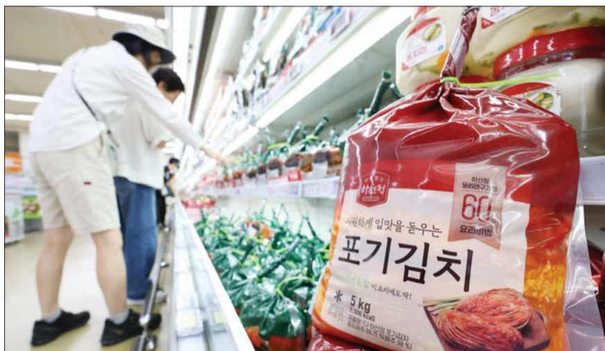
서울의 한 대형마트에 포기김치가 진열되어 있다.

김장포기족증가로 포장김치 판매량은 상승세를 거듭할 것으로 예상된다. 지난달 기준 아워홈의 배추김치 매출은 전년 대비 110%, 대상과 CJ제일제