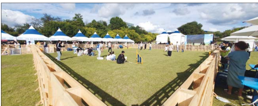
반려견 놀이터 전경사진.

임종식 교육감은 "전 국민에게 독도 사랑과 독도 수호 의지를 높이기 위해 3년째 흥미를 끌 수 있는 다양한 방식으로 사이버독도학교 전국화 사업을 진행해 왔다"며 "이번 사업이 전 국민에게 독도 사랑 실천의 기회를 제공하며, 범국민적 관심을 높여 독도 수호 의지를 강화하는 계기가 되길 바란다"고 말했다. /경북=김상복 기자 ksb8100@