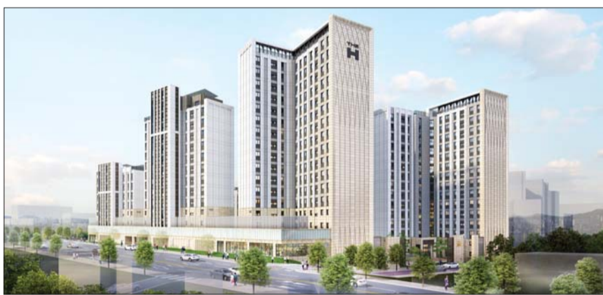
'디에이치 대치 에델루이' 투시도.

면적별로는 전용면적 60㎡ 초과 85㎡ 이하 구간의 경쟁률이 668.5대 1로 가장 높았다. 3~4인 가족 수용 여부와 계약금 마련 등을 고려할 때 가격 부담이 비교적 적은 중소형 면적대의 경쟁률이 높았던 것으로 보인다. 85㎡ 초과