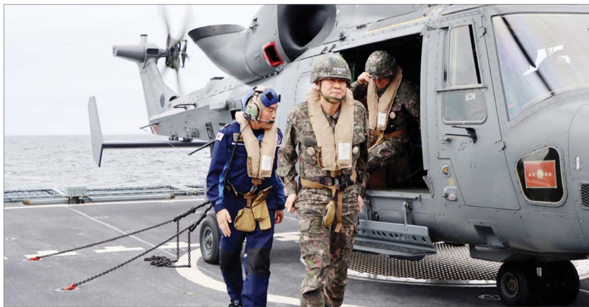
군, 화력대기태세 강화

이는 삼성전자가 3분기 실적 부진 여파로 전 부회장이 이례적인 반성문을 발표했던 만큼, 대대적인 내부 물갈이를 통해 본격적인 쇄신 작업에 돌입할 것이라 관측이 높다.