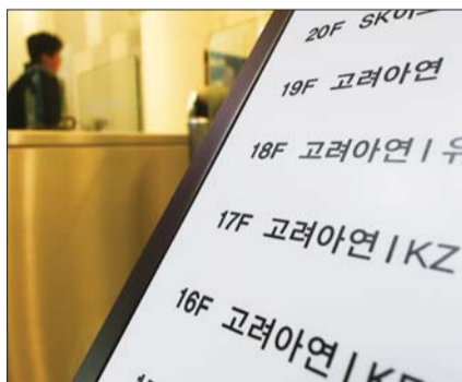
21일 서울 종로구 고려아연 본사 내부에 총법안내문이 놓여 있다.

이번 가치분 신청이 법원에서 기각되면서 고려아연 주가가 급등세를 보이고 있다. 고려아연의 공개매수 절차가 그대로 진행될 것이라는 전망에 매수세가 몰린 것으로 분석된다.