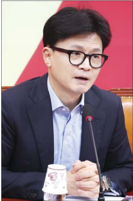
한동훈 국민의힘 대표가 24일 오전 서울 여의도 국회에서 열린 최고위원회의에서 발언을 하고 있다.

한동훈 국민의힘 대표는 24일 국회 최고위원회의에서 전날(23일) 언급한 특별감찰관 추천 이야기를 다시 꺼냈다. 특별감찰관은 대통령 친인척의 비리를 감시하는 역할로, 국회가 3명의 후보를 추천해야 한다.