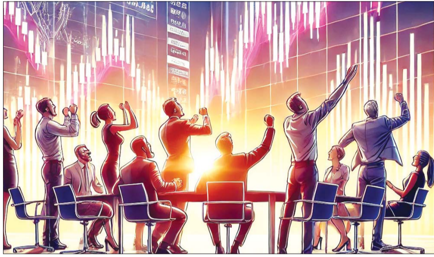
ChatGPT에 의해 생성된 증시 반등을 기대하는 투자자 이미지.

'검은 월요일'을 맞이했던 지난 8월 5일 이후 투자자예탁금은 꾸준히 감소세를 보였다. 이날 투자자예탁금은 59조대를 기록했지만 이후 5거래일 만에 53조대로 내려앉았으며, 9월 20일과 이달 8일 50조대까지 떨어졌다. 이 기간 동안 코스피지수는 박스권에 갇히면서 2600선을 두고 등락을 반복했고, 지수 변동성이 확대되면서 거래대금도 감소하는 등 국내 증시의 매력도가 반감되