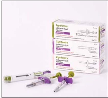
인플릭시맙 피하주사(SC) 제형 치료제 '짐펜트라'

셀트리온은 지난 3월 세계 최대 의약품 시장인 미국에 짐펜트라를 출시한 이후 보름여 만에 3대 PBM 중 하나인 익스프레스스크립츠(ESI)와 등재 계약을 체결한데 이어, 올 7월에 또 다른 대형 PBM 한 곳과 등재 계약을 맺었