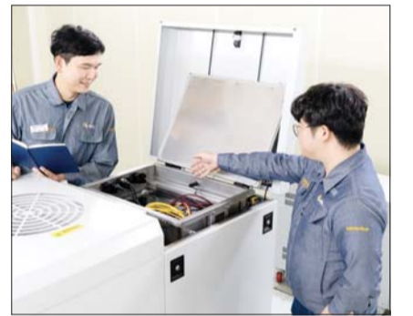
에쓰오일 직원들이 액침냉각유 성능테스트를 진행하고 있다.

고인화점 제품은 특히 위험물안전규제가 엄격한 한국, 일본 등 동북아 시장에서의 수요가 기대되고 있다. 대규모 데이터센터에 액침냉각 기술을 도입하려면 위험물안전관리법, 소방법에 따른 규제가 해당되지 않는 제