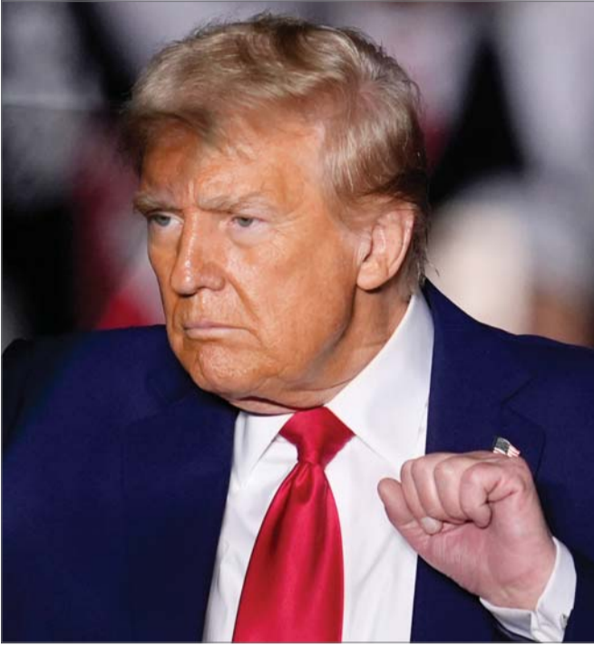
불 붙은 美 대선

미국 민주당 대선후보인 카말라 해리스 부통령(왼쪽 사진)이 미국 대선(11월 5일)을 불과 8일 앞둔 28일(현지시각) 미시간주 앤아버 유세에서 “우리가 승리할 것”이라며 지지자들에게 조기 투표 참여를 독려했다. 같은날 공화당 대선 주자인 도널드 트럼프 후보가 자신을 향한 나치·파시스트 공세를 정면으로 받아쳤다. (관련기사 3면)