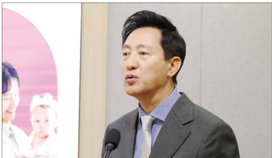
오세훈 서울시장이 29일 서울시청 브리핑룸에서 탄생응원 서울 프로젝트 시즌2 언론 브리핑을 하고 있다.

무주택 신혼에 '미리 내 집' 1000호 거주기간 10년, 자녀 낳으면 20년 일·생활 균형 실현 중소기업 인센티브 육아용품 반값 온라인몰 내년 오픈