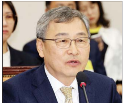
정근식 서울시교육감이 지난 22일 오전 서울 여의도 국회 교육위원회에서 열린 서울시교육청, 경기도교육청 등에 대한 국정감사에서 의원들의 질의에 답변하고 있다.

교육청으로 증액 교부 하는 예산은 전국 1조원, 서울 1761억원이었다"라며 "하지만 2025년도 정부 예산안은 이 법안의 일몰을 전제로 고교 무상교육 증액교부금을 편성하지 않아 서울시교육청도 고교 무상교육 증액교부금을 세입에 반영하지 못했다"고 말했다.