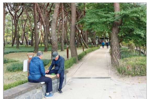
어르신들이 솔밭근린공원에서 장기를 두고 있다.

교복을 입은 중·고등학생들은 공원에서 자전거 라이딩을 했고, 20~30대 청년들은 헤드폰을 머리에 얹고 빠른 걸음으로 산책했다. 중장년층은 둘 혹은 넷씩 짝을 이뤄 배드민턴을 즐겼다.