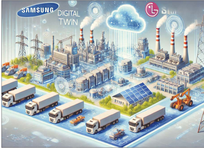
Chat GPT에 의해 생성한 ‘디지털 트윈 기술이 제조, 물류, 에너지 산업 전반에 걸쳐 활용되는 모습’을 담은 이미지.

삼성전자는 엔비디아의 옴니버스 플랫폼을 활용해 2030년까지 반도체 공정에 디지털 트윈을 구현한다고 밝혔다. 앞서 삼성전자는 2022년부터 디지털 트윈 데스크톱(DF)을 신설하고, 지난해 4월 디지털트윈 분야 전문가인