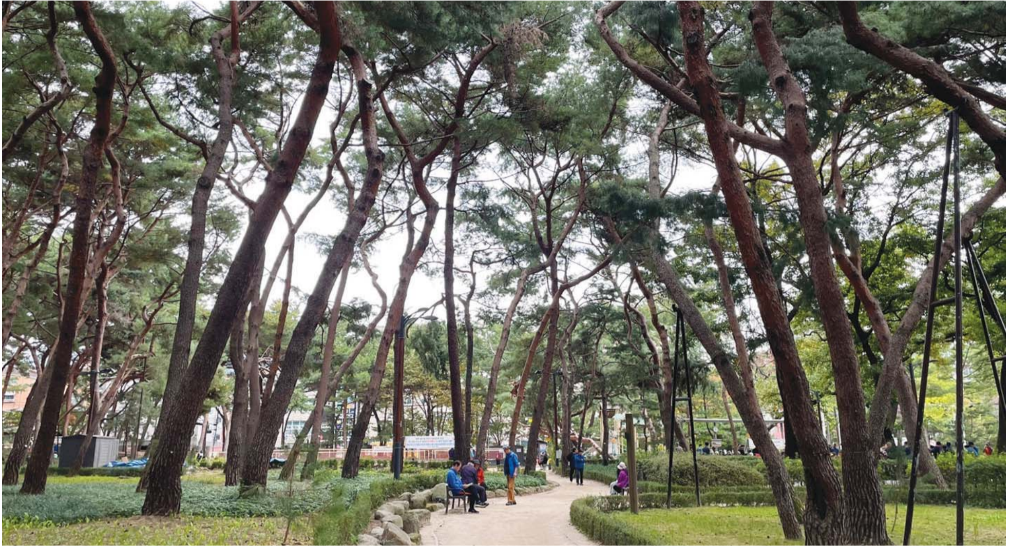
14일 오후 어르신들이 솔밭근린공원에서 담소를 나누고 있다.