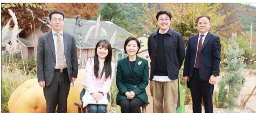
오영주 중소벤처기업부 장관(가운데)이 29일 강원 춘천 카페 감자밭에서 열린 ‘제9차 소상공인 우문현답 정책협의회’ 참석에 앞서 카페 현장을 둘러본 후 관계자들과 기념 촬영을 하고 있다.

오영주 중소벤처기업부 장관이 소상공인을 혁신기업으로 적극 육성하겠다는 의지를 다시 한번 밝혔다.