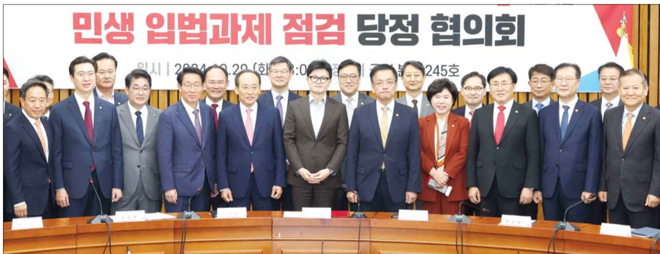
한동훈 국민의힘 대표가 29일 오후 서울 여의도 국회에서 열린 민생 입법과제 점검 당정협의회에서 각 부처 장관을 비롯한 참석자들과 기념촬영을 하고 있다.

한동훈 국민의힘 대표는 협의회 모두발언에서 "윤석열 정부 1년차가 비정상화를 정상화하는 것이고 2년차가 개혁과제를 드라이브하는 것이었다면, 3년차는 성과를 하나씩 국민께 체감시켜야 한다"며 "그렇기 때문에 윤석열 정부가 추진한 민생 입법과제와 개혁 완수를