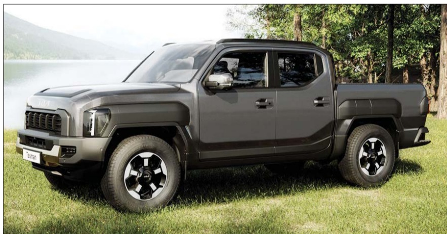
기아 '더 기아 타스만' 외장.