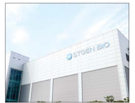
에스티젠바이오 사옥 전경.

에스티젠바이오의 핵심 사업은 바이오의약품 위탁생산(CMO)과 위탁개발생산(CDMO) 서비스다. 에스티젠바이오는 항체의약품, 재조합 단백질 등과 관련된 원료의약품과 프리필드스리니지 제형의 완제의약품을 생산