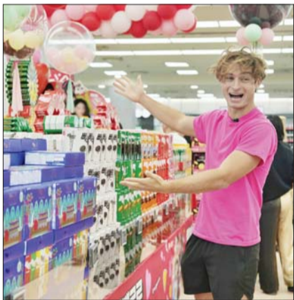
롯데마트 제타플러스 서울역점에서 해외 유튜브 토퍼 길드가 한국 '빼빼로' 쇼핑을 소개하는 콘텐츠를 촬영하고 있다.

롯데월드, 토퍼길드 등 10명 韓 방문 빼빼로 맛보고 미국에 택배로 발송 성수 팝업서 숏츠 챌린지영상 촬영