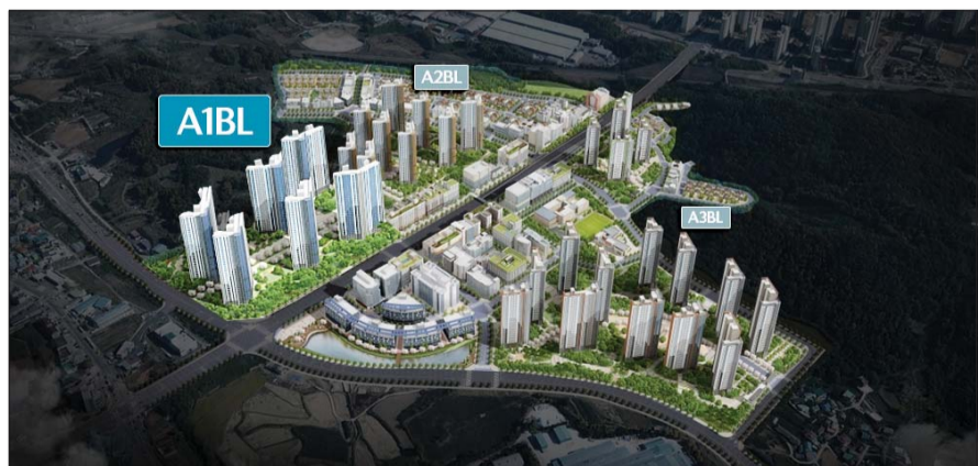
아산탕정자이 퍼스트시티(A1블록) 조감도.

불당지구는 학원가, 다양한 편의시 설 등 편리한 생활 인프라를 갖췄다. 아 산탕정2는 약 4만 5000명 수용하는 규 모로 조성되며, 2025년 착공에 이어 2029년 완공을 목표로 현재 토지보상이 진행 중이다. 향후 사업지와 불당지구