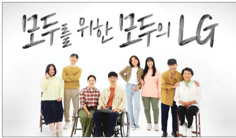
LG전자는 29일 ‘모두를 위한 모두의 LG’ 캠페인 영상 9편을 제작해 유튜브에 공개했다.

LG전자가 시각·청각·지체장애인과 시니어 이용자를 위한 ‘모두를 위한 모두의 LG’ 캠페인을 전개한다.