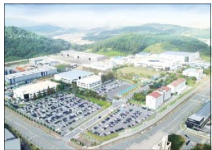
삼성전기 세종 사업장

삼성전기는 AI·전장·서버 등 시장 성장으로 AI용 MLCC 및 서버용 반도체 패키지기판, 전장용 카메라 모듈 등 고부가 제품 공급이 증가해 전년 동기,