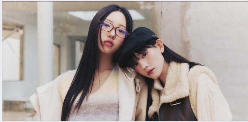
미쏘 어반 보호(URBAN BOHO) 캡슐 컬렉션 화보.

버커루 '우먼 벨벳 데님' 선봬 드뮤어 트렌드 '절제미' 돋보여 카카오스타일 양면 착용 가능한 리버시블 코트·재킷 검색량 급증 미쏘 보헤미안 트렌드 반영한 시즌 상품군 '어반보호' 선보여