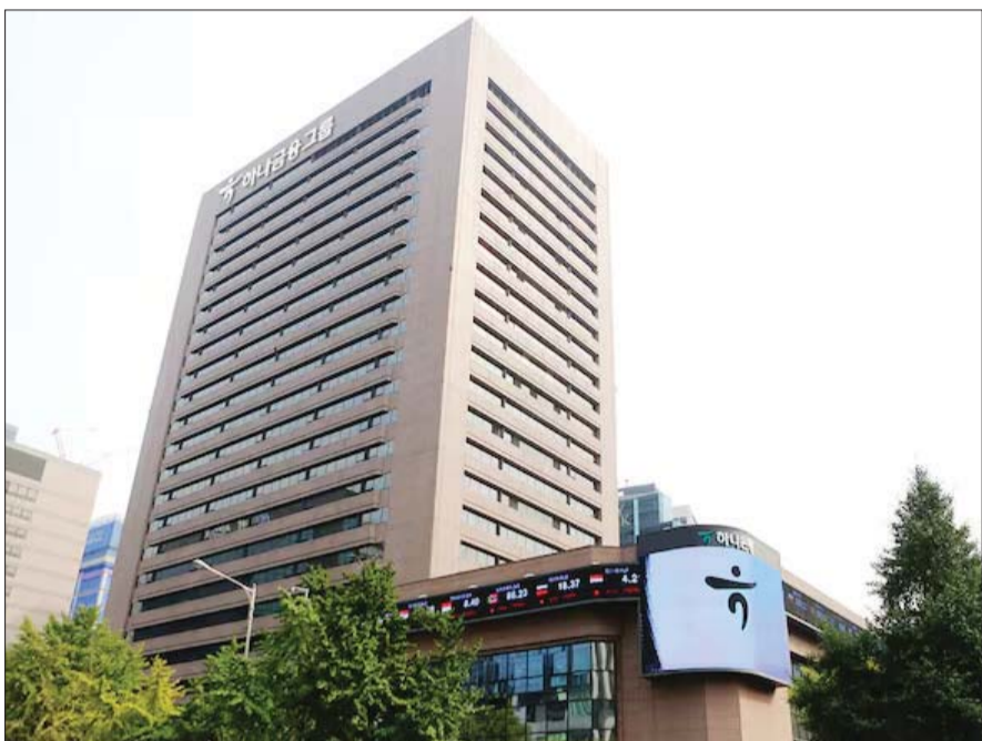
하나금융그룹 명동사옥 전경