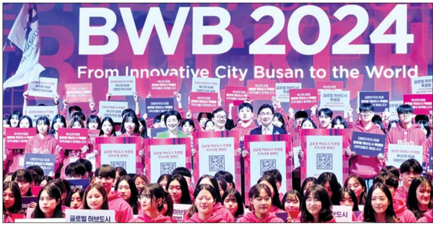
지난 28일 부산 해운대구 시그니엘 부산에서 블록체인 위크 인 부산(Blockchain Week in Busan·BWB) 2024가 개막했다.

실무자산 토큰화 거래 플랫폼 지향 부산시 연계 아이템으로 STO 선도 디지털 신분증 분야, 시민 체감률 ↑