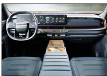
기아 '더 기아 타스만' 실내 모습.

을 확보했다. 가솔린 2.5터보 엔진과 8단 자동 변속기를 조합해 최고 출력 281마력(PS), 최대 토크 43.0kgf·m를 발휘한다. 또 4WD 시스템을 통해 샌드, 머드, 스노우 등 터레인 모드를 제공하며 인공지능이 노면을 판단해 적합한 주행 모드를 자동으로 선택하는 '오토 터레인 모드'도 지원해 노면에 맞도록 차량을 최적 제어한다.