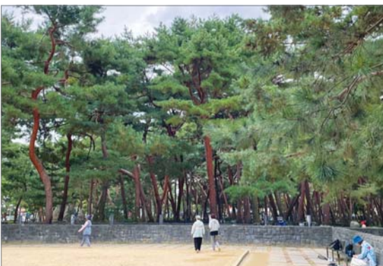
시민들이 솔밭근린공원에서 맨발 걷기를 하고 있다.

가을의 낙엽처럼 시간의 흐름에 순응하는 법을 배워나가고 있는 사람들과 달리 공원의 소나무들은 제법 쌀쌀해진 날씨에 굴하지 않고 짙은 녹음을 뽐냈다. 솔밭공원은 서울 유일의 평지형 소나무 군락지로 60~100년생 소나무 1000여그루가 자라나고 있다.