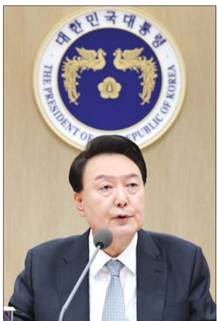
윤석열 대통령이 29일 서울 용산 대통령실 청사에서 열린 제46회 국무회의에서 발언하고 있다.

윤 대통령은 ▲창의적인 미래 인재 양성 ▲안정적인 노사관계 속 일·가정 양립 ▲전국 어디서든 질 높은 의료 해