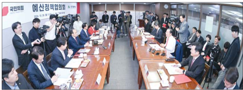
지난 28일 국회의원회관에서 홍준표 대구시장과 국민의힘 추경호 원내대표, 김상훈 정책위의장 등 지역 국회의원들이 예산정책협의회를 진행하고 있다.

포항시는 시 청사 행정동 2층 로비를 리모델링하고 시민과 함께하는 민원 소통 공간으로 새롭게 단장했다. 포항시는 민원인이 방문부서를 찾지 않고 공무원이 직접 민원 상담실에서 응대하는 시스템을 운영 중이며, 이번에 리모델링한 2층 로비 민원상담장은 이 시스템의 핵심적인 운영 공간이 되어 행정 이용의 편의성을 더욱 높일 것으로 기대된다. 특히 시는 로비를 따뜻하고 밝은 분위기로 조성해 편안한 민원 응대 분위기를 만들어 시민 누구나 이용할 수 있는 새로운 휴식 공간을 만드는 것에 중점을 뒀다. /포항(경북)=최지용 기자