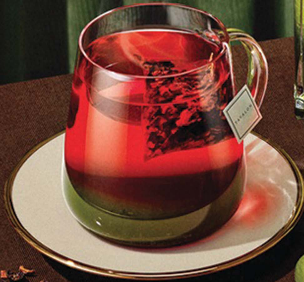
다래 레드 스위트 5.9