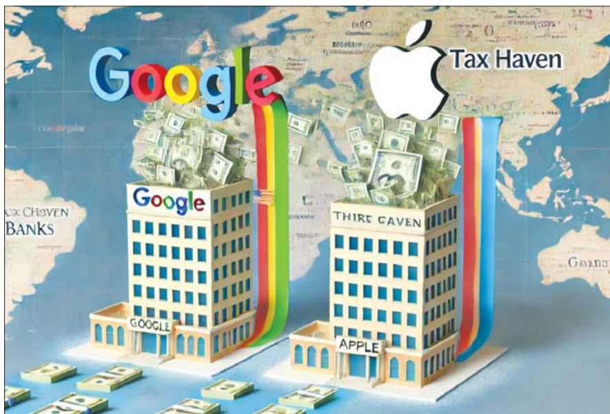
구글 등 주요 글로벌 빅테크 기업들이 한국에서 사업을 영위해 벌어들인 돈을 제 3국가 법인의 매출로 이전함으로써 세금 납부를 회피하고 있다. 2020년 G20에서 2023년까지 디지털세 도입을 내용으로 하는 조세개혁안 합의가 있었으나 우리나라는 여전히 첫걸음도 못 떴고 있다.

구글세(Google Tax)로도 불리는 디지털세(Digital Tax)는 특정 국가내에 고정된 사업장이 없더라도 매출이 발생하는 글로벌 IT 기업에 매겨지는 법인세와 별도 세금을 뜻한다. 기존 국제 조세 기준으로는 물리적 고정 사업장이 있을 때만 과세 가능했다. 디지털세는 전통적인 조세 기준에서 벗어나 ICT 기