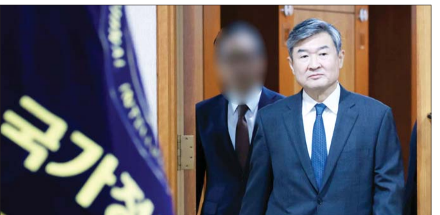
조태용 국가정보원장이 29일 서울 서초구 내곡동 국가정보원에서 열린 국회 정보위원회의 국정원에 대한 국정감사에 출석하고 있다.

국정원, 국정감사 브리핑 고위급 군 장성 포함 가능성 장교 휴대전화 사용 금지하고 병사·가족들 입단속 정황 포착