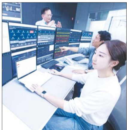
LG유플러스 임직원들이 통합관제센터에서 최상의 네트워크 품질을 제공하기 위해 이상 상황에 대응하고 있는 모습.

올해 3월부터 가동된 통합관제센터는 빅데이터 기반 지능형 자동화 시스템을 통해 전국의 네트워크와 외부 서비스의 품질을 24시간 모니터링하며, 신속한 대응으로 고객에게 안정적인 서비스를 제공하는 역할을 맡고 있다.