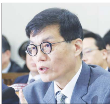
이창용 한국은행 총재(오른쪽)가 29일 서울 여의도 국회에서 열린 기획재정위원회의 한국은행 종합 국정감사에서 의원 질의에 답하고 있다.

그는 “우리나라의 수출을 보면 수출금액은 떨어지지 않은 반면 수출액은 떨어지고 있다”며 “자동차파업 등 일시적인