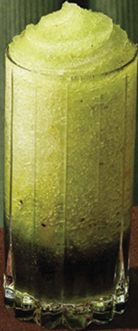
다래 그린 스노우 ICE ONLY 6.9