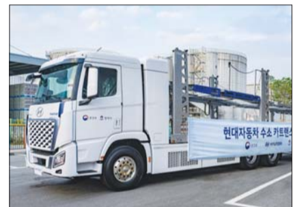
현대차가 경기 평택항서 시범 운영할 엑시언트 수소전기트럭 카트렌스포터.