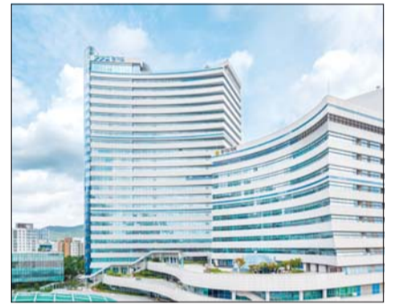
경기도청 전경.

앞서 국토교통부는 지난해부터 부동산 공시가격의 신뢰성을 높이기 위해 광역지방자치단체에 검증센터를 설치