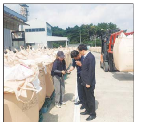
국립농산물품질관리원 경북지원은 대구·경북 13개 시군에서 쌀 민간물량 매입 검사를 실시한다.