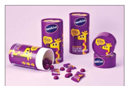
썬키스트 키즈 트리플 구미 이문하이 /광동제약

또 이번 신제품은 착색료를 넣지 않고 프락토올리고당, 비타민C와 과채가 공품을 부원료로 사용해 안심하고 섭취할 수 있다는 것이 광동제약 측 설명이다.