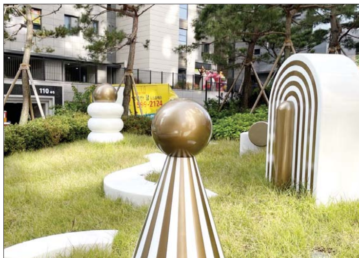
조각상 '블록 패밀리'.