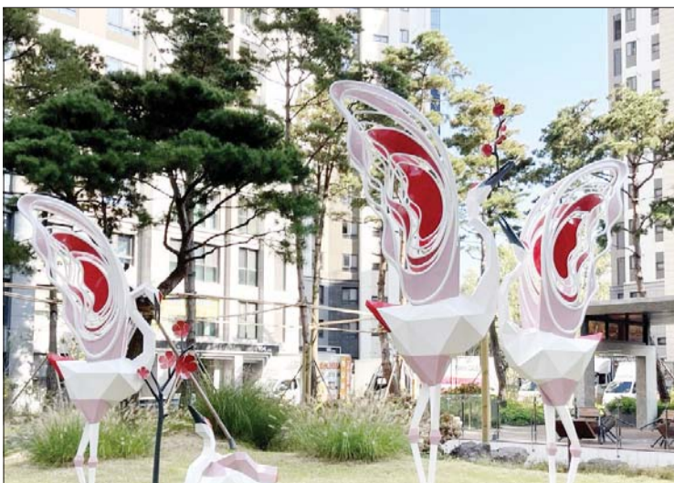
조각상 '행복 찾아 꿈 찾아'.