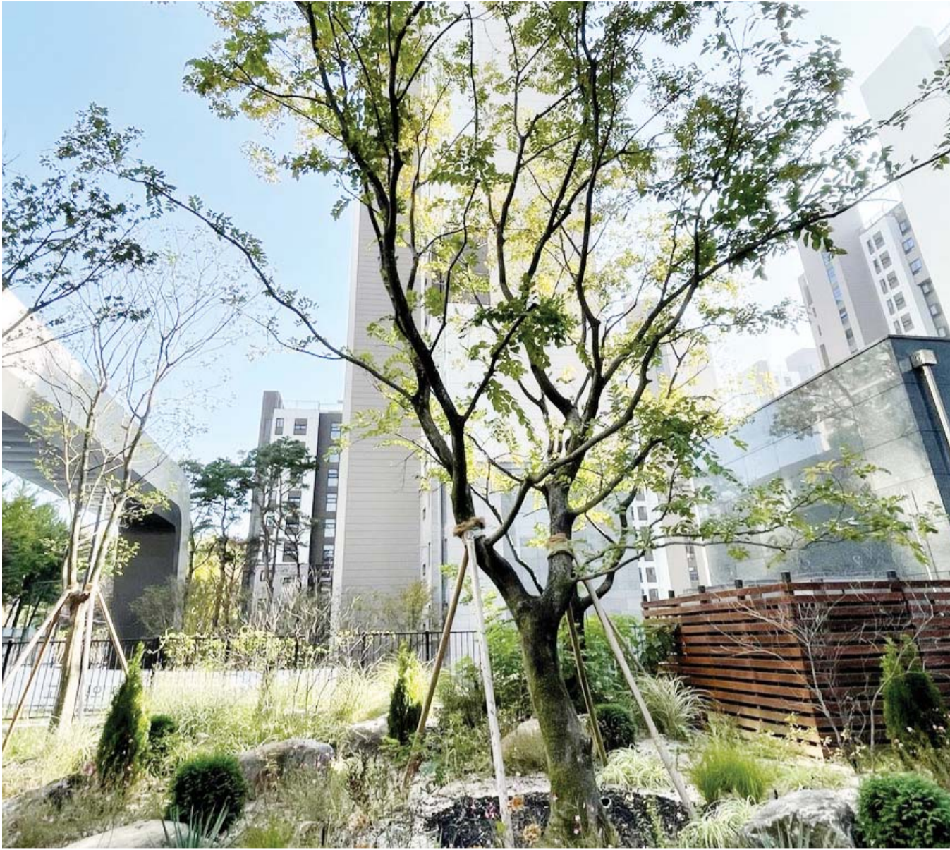
힐스테이트e편한세상문정 단지내 조경 전경