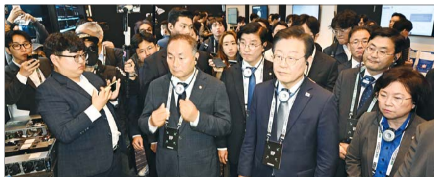
이재명 더불어민주당 대표가 4일 서울 강남구 코엑스에서 열린 SK AI 서밋에 참석해 OpenAI, Microsoft, NVIDIA, AWS, google cloud 등 글로벌 AI 기업과 SK 등 주요 국내기업, 스타트업 부스를 둘러보고 있다. /*뉴스

한편, 민주당은 의총에서 방위사업법 개정안과 계엄법 개정안을 당론으로 채택했다. /*박태홍 기자