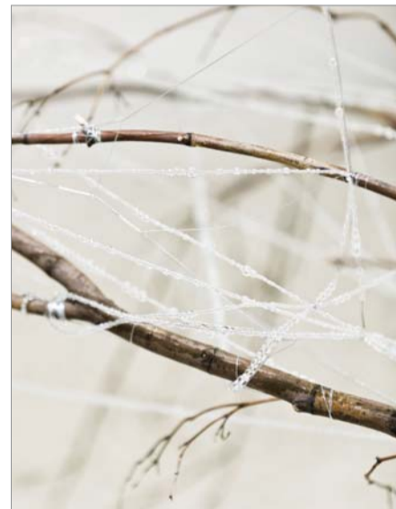
빛, 숨, 결 설치물 일부.