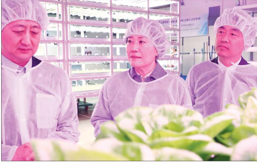
송미령 농림축산식품부 장관(가운데)과 안덕근 산업통상자원부 장관(왼쪽)이 지난 3월26일 경기 평택에 자리한 수직농장 전문기업을 찾아 시설물을 둘러보고 있다.

하고 있어, 농작물을 재배하는 농업 부문에 해당하는 수직농장은 입주가 허용되지 않았다”며 “이번에 수직농장이 농작물 생산시설로는 최초로 산업단지 입주자격을 얻게 됐다”고 설명했다.