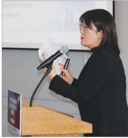
중소벤처기업연구원 연구위원이 19일 '美 대선 결과에 따른 중소기업 대응 방안' 세미나에서 발표하고 있다.

19일 서울 여의도 루나미엘레 파크뷰홀에서 연 '미국 대선 결과에 따른 중소기업 대응 방안' 관련 세미나에서 나왔다.